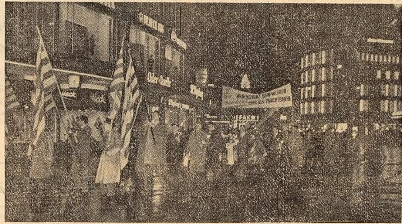
Recent la Hanovra (R. F. Germană) a avut loc un impunător „marș al tacerii” la care au participat peste 500 de luptători din rezistență. Demonstrația a fost organizată în semn de protest împotriva politicii de înarmare promovată de guvernul Adenauer și a reinvierii fascismului în Germania occidentală.

În declarație sînt denaturate în mod flagrant propunerile sovietice cu privire la reglementarea pașnică cu Germania.