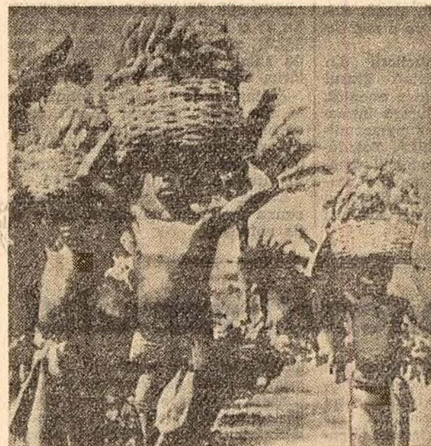
Copii fără copilărie! Din cea mai teribilă vîrstă copiii din țările africane aflate încă sub jugul colo-nial sînt nevoiți să muncească din zori pînă în noaptea pe plantațiile colonialiștilor.