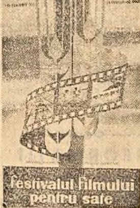
Festivalul filmului pentru sate

Festivalul este menit să contribuie la educarea multilaterală a țărănimii, la realizarea importantelor sarcini trasate de partid în domeniul transformării socialiste a agriculturii și sporirii producției agricole. Înjăgind acest lucru, comisiile regionale și raionale de partid, organizațiile de partid din comune și sate, staturile populare, vor sprijini activ buna desfășurare a Festivalului filmului pentru sate.