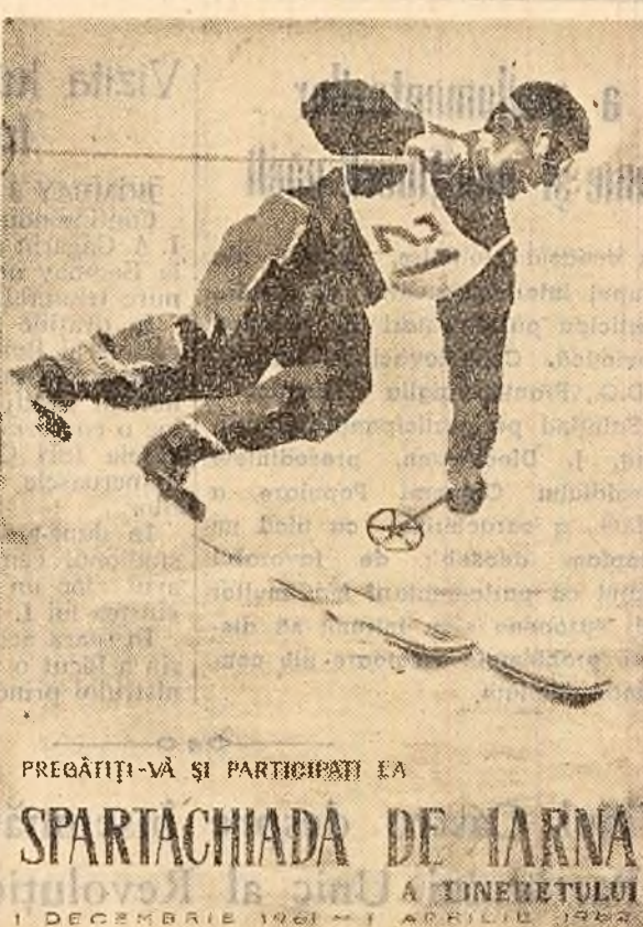
PREGĂTIȚI-VĂ ȘI PARTICIPAȚI LA SPARTACHIADA DE IARNĂ A TINERETULUI 1 DECEMBRIE 1961-1 APRILIE 1962

Prima etapă a Spartachiadei durează până la 1 februarie 1962. Sporturile incluse în regulamentul sînt următoarele: gimnastică, haltere, patinaj, șah, tenis de masă, trîntă, schi, sînuție.