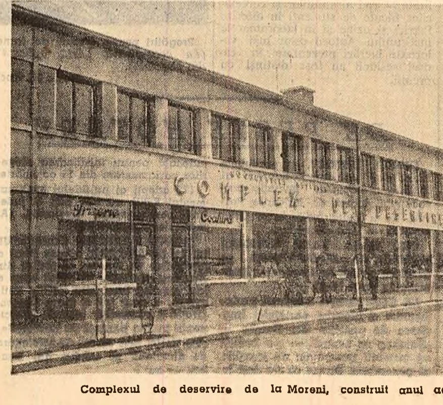
Complexul de deservire de la Moreni, construit anul acesta.

Tempul probabil pentru zilele de 5, 6 și 7 decembrie: Vremea se menține în general călduroasă, cu cerul variabil. În nordul țării se vor produce înnoiri și vor cădea puțol locale. Vînt slab pînă la ridicat la vest. Temperatura se menține în jurul înecut, apoi va scădea ușor. Mîjmela vor între 6 și 16 grade, iar maximele în intervalul.