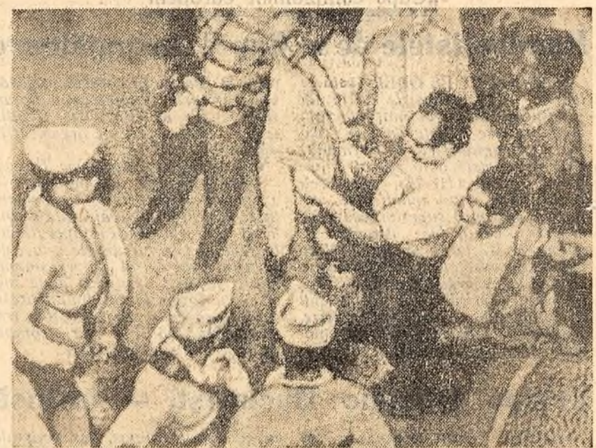
În Republica Dominicană continuă manifestațiile împotriva lui Balaguer și a cîlicii sale militariste. Iată o imagine de la una din manifestațiile de protest desfășurate în capitala dominicană Santo Domingo.