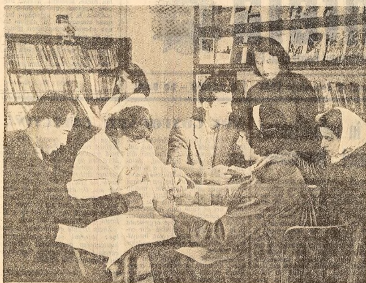
Biblioteca din comuna Dărmănești, raionul Ploiești, este frunțașă pe regiune. În acest an, biblioteca a împrumutat cititorilor peste 23.000 volume. În fotografie: un aspect din bibliotecă.

Rezultă că anul acesta, aproape 50 la sută din venitul bănesc total realizat de gospodărie se obține din valorificarea produselor animale. Cu toate succesele obținute, colectiviștii din Beilic știu că au încă posibilități mari de creștere a producției de lapte și în general a producției animale. Ei sint hotărîți să-și sporească eforturile pentru ca gospodăria lor colectivă să devină tot mai înfloritoare. M. ROTARU coresp. „Scintei”