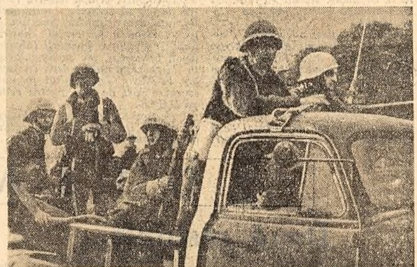
Unități polițienești motorizate, înarmate pînă în dinți, (așa cum se vede în fotografia de mai sus) sînt folosite de colonialiștii englezi pentru a înăbuși lupta de eliberare națională din Rhodesia.