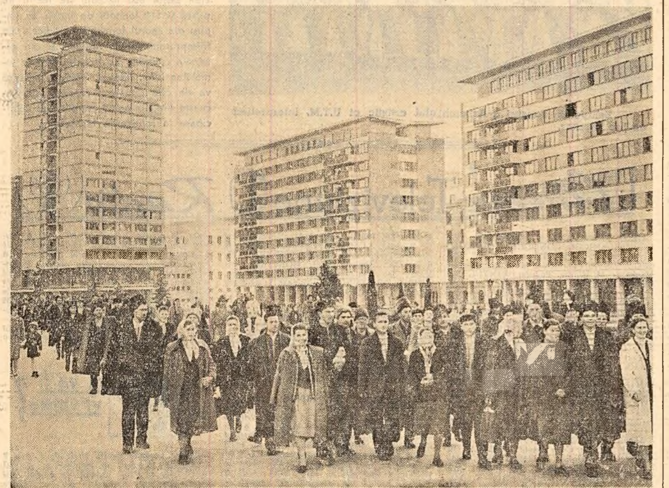
700 de colectivizati din raionul Negrești, regiunea Iași, au sosit în vizită în Capitală. Simbătă, ei au făcut turul orașului iar ieri au vizitat principalele construcții ale Bucureștiului.

GALAȚI (coresp. „Scinteii”). — Colectivele de muncă ale întreprinderilor din industria republicană, construcții, transporturi și industria locală din orașul Galați au înregistrat, la sfîrșitul celor 10 luni de activitate, însemnate depășiri de plan. Prin creșterea productivității muncii, reducerea consumurilor specifice și a celorlalte cheltuieli de producție, aceste întreprinderi au economisit la prețul de cost peste plan, 19.183.000 lei. Peste 10.000.000 lei economii au fost realizate de întreprinderile din ramura transporturilor.