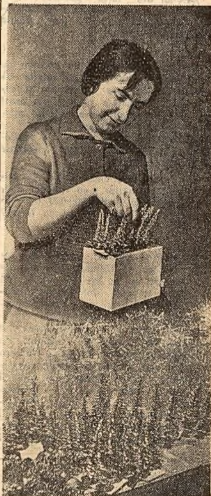
Pregătit pentru pomul de iarnă (La cooperativa „Artă aplicată” din Capitală).