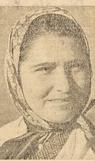
G.A.C. "Viața nouă" din comuna Poiana Mare, regiunea Oltenia, are 519 bovine din care 250 de vaci și juninci...