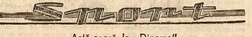
Astăzi-seară la „Dinamo”

WEIMAR 4 (Agerpres). — După cum s-a mai anunțat, la Weimar a avut loc Conferința internațională a parlamentarilor din țările Europei. La lucrările conferinței au participat membri ai parlamentelor Angliei, Belgiei, R.D.G., Italiei, Poloniei, U.R.S.S., Franței și Cehoslovaciei.