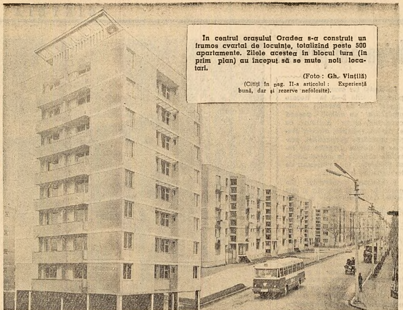
În cadrul orașului Oradea s-a construit un frumos cvaral de locuințe, totalizând peste 500 apartamente...