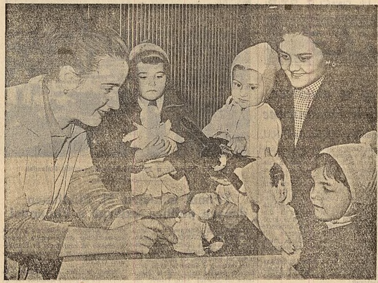
E grea alegerea...