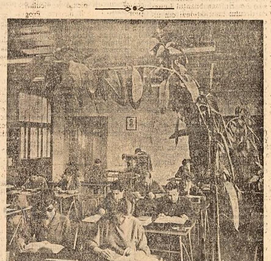
La Biblioteca centrală universitară „Mihail Eminescu” din Iași.

Apărut... recent, Almanahul turistic 1962, editat de Oficiul Național de Turism „Carpați”, înlesnește amatorilor de drumeție alegerea locurilor celor mai pitorești de țară pentru excursii. Almanahul face cunoștință cititorului cu „Orașul cerului” sau este, denumită „Mamaia, îl poartă apoi prin „Vrancea, țară de basm”, prin „peștera Ursilor etc. Nu lipsesc calendarul vânătorului și pescarului sportiv, paginile de umor, rubricile „Știați că...” și curiozități. Cu interes sînt urmărite opiniile despre frumusețea țării noastre ale unor vizitatori de peste hotare, re-