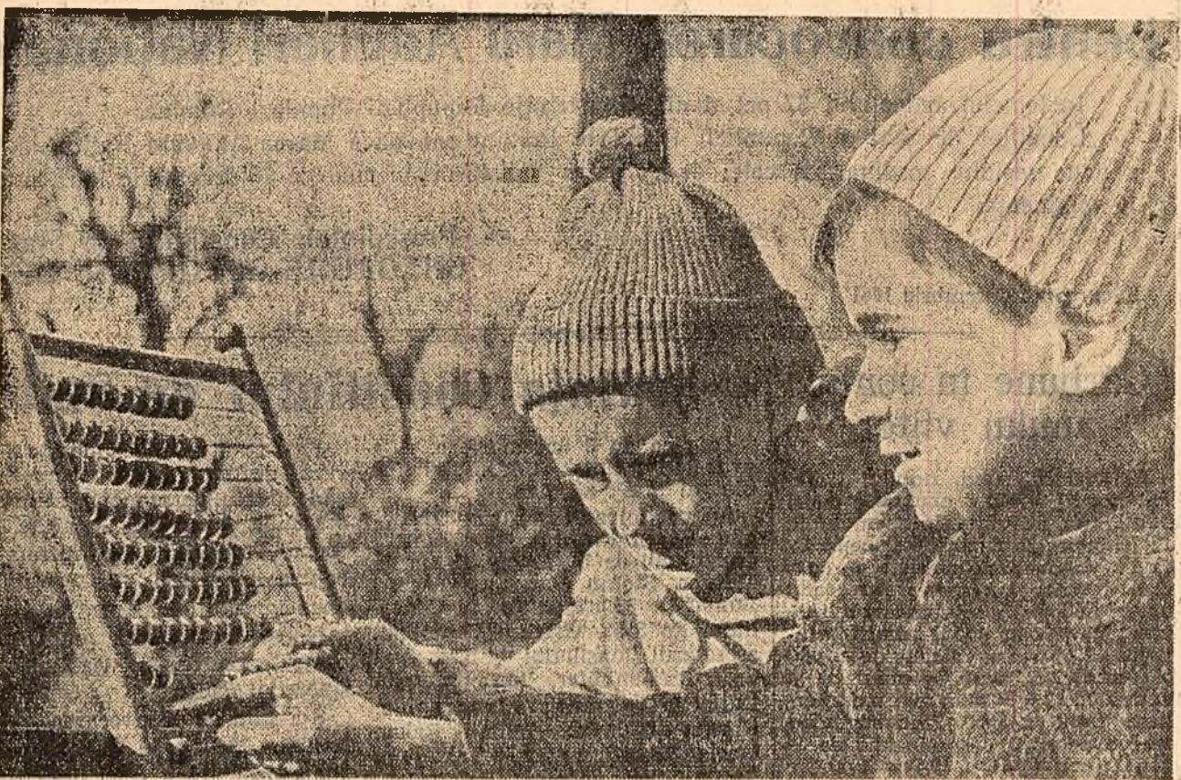
Ce-i drept, nu-i o mașină electronică de calcul, dar pentru micii matematicieni e bună și numărătoare.