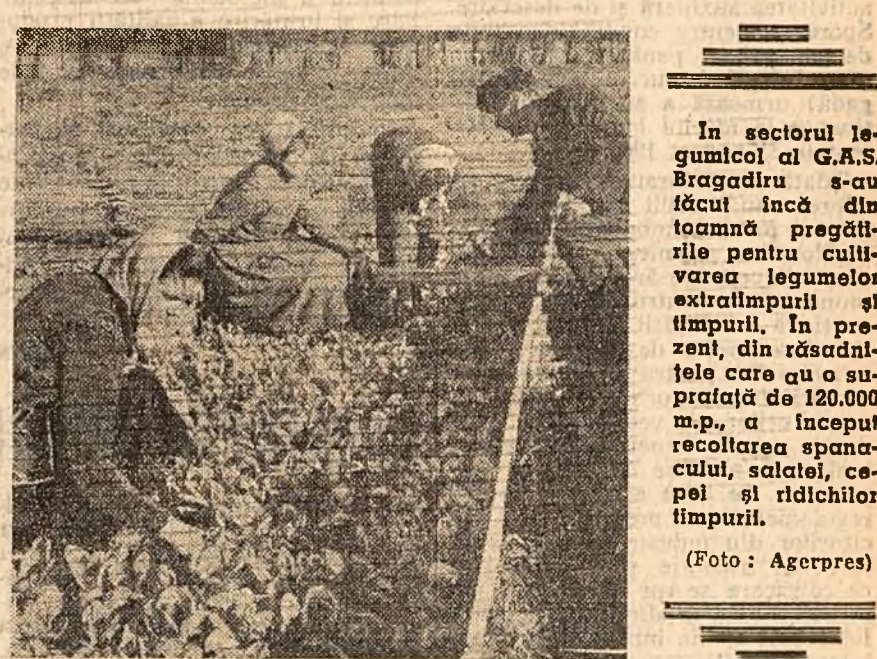
In sectorul legumelor al G.A.S. Bragadaru s-au făcut încă din toamnă pregătirile pentru cultivarea legumelor extratimpurii și timpurii. În prezent, din răsădnițele care au o suprafață de 120.000 m.p., a început recoltarea spanacului, salatei, cepei și ridichilor timpurii.

În cele mai pitorești localități de munte — Timiș, Bran și altele — se vor deschide în această iarnă taberele de pionieri și școlari. Vor sosi în frumosele locuri de recreere din regiunea Brașov peste 1.000 de copii din București, Bacău, Pitești etc., unde vor sta tot timpul vacanței școlare. Pentru primirea lor au început încă de pe acum pregătirile. La vîlele din stațiuni se revizuează instalațiile de încălzit și iluminat, se fac mici reparații și zugrăviri.