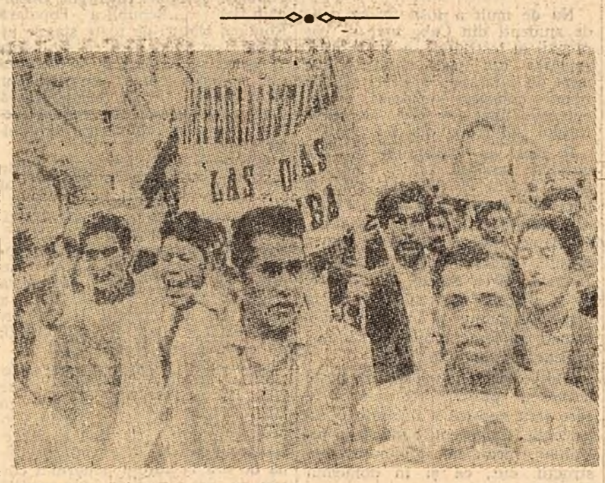
Aspect de la o demonstrație de solidaritate...