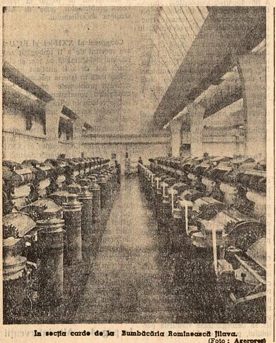
În secția corde de la Bumbăcăria Romînească Ilava.

În acest an, peste 400.000 femei din regiune au participat la acțiuni patriotice de interes obștesc.