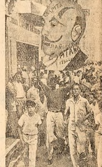
SANTO DOMINGO. Aspect de la o manifestație populară împotriva regimului lui Balaguer, continuată al dictaturii lui Trujillo.