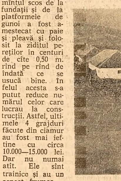
O parte din construcțiile gospodăriei colective „23 August”, din satul Pribesti, raionul Vaslui.