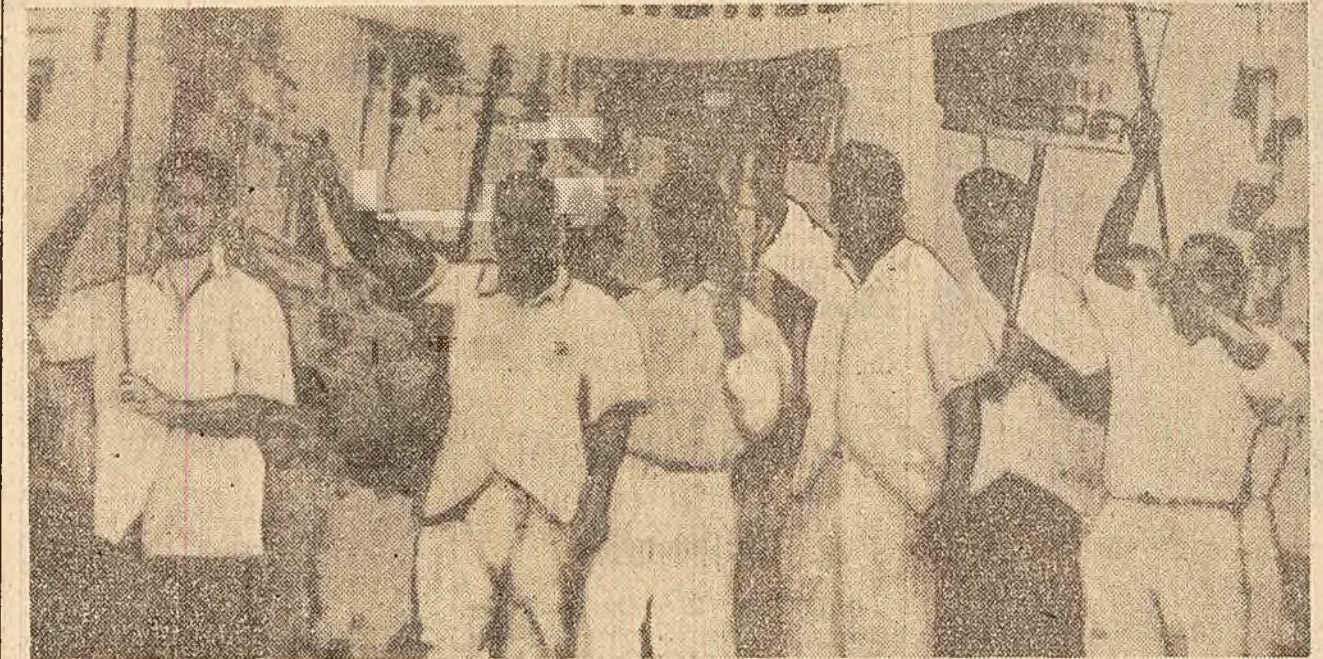
Aspect de la o manifestație în Bombay după eliberarea teritoriului Goa.