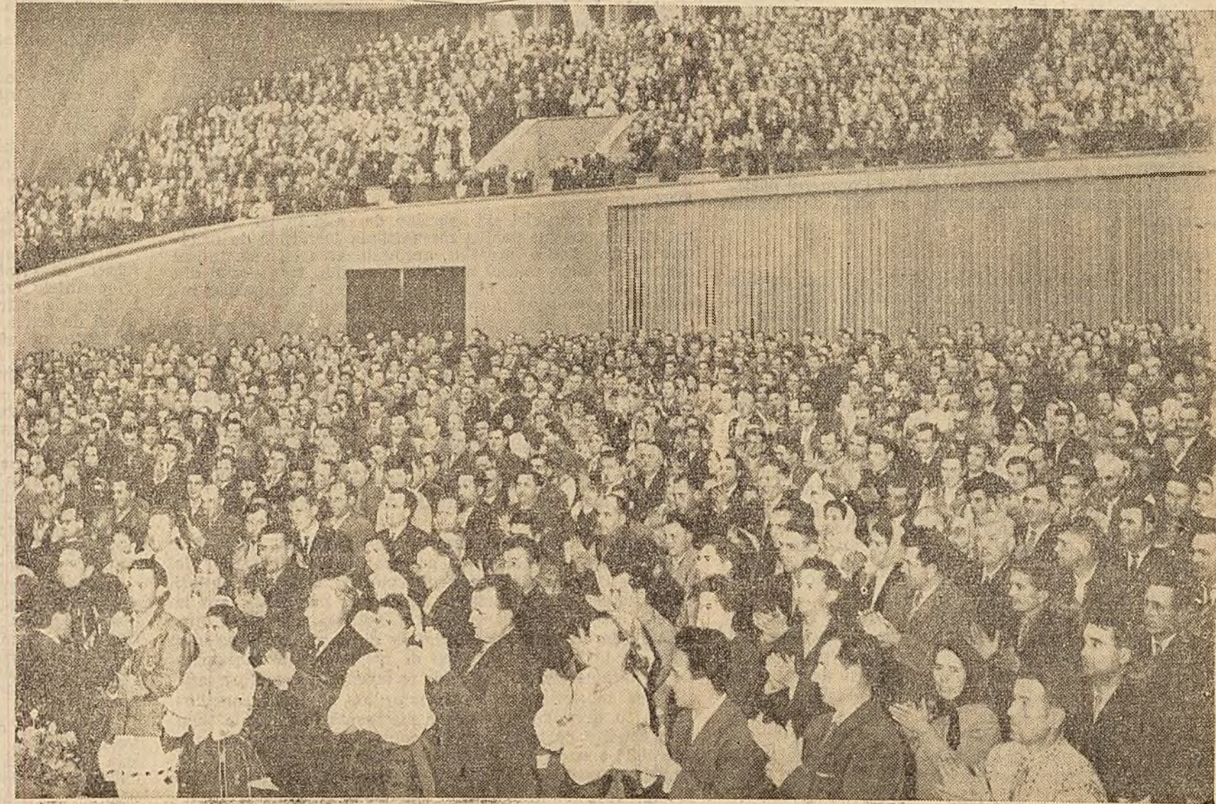
Participanții la Consfătuire aplaudă cu însuflețire cuvîntarea tovarășului Gheorghe Gheorghiu-Dej.

Declarănd incluse lucrările Consfătuirii, tovarășul Gheorghe Apostol a spus, printre altele: Consfătuirea noastră, care s-a desfășurat în cinci zile de muncă rodnică, a demonstrat din nou încrederea cu care țărănimea urmează și înfăptuiește politica partidului nostru. Dezbaterile care au avut loc aici, cuvîntarea deosebit de importantă a tovarășului Gheorghe Gheorghiu-Dej sînt pline de învățăminte prețioase pentru țărăni-