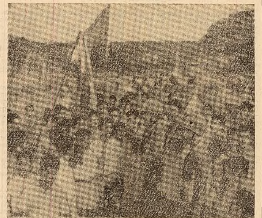
Populația din Panjim împlință cu sleguși sosirea trupelor indiene în Goa.

S-a dat apoi cuvîntul lui L. F. Iliecv, secretar al C.C. al P.C.U.S., care a prezentat raportul — Congresul al XXII-lea al P.C.U.S. și sarcinile muncii ideologice a partidului.