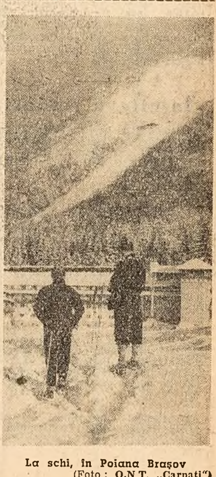
La schi, în Poiana Brașov

Din constatările făcute pe teren reiese că există suficiente posibilități pentru ca zăpada să nu sîntenească cu nimic desfășurarea normală a vieții orașelor. Colectivele întreprinderilor, comiteele de străzi și de bloc, cetățenii, tineretul sînt chemați să dea tot sprințul în această importantă acțiune cetățenească.