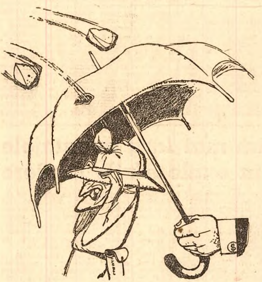
La „adăpost”... (Desen de EUGEN TARU)