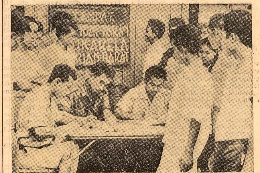
DJAKARTA. Numeroși lîneri indonezieni se prezintă la centrele de înscriere a voluntarilor pentru eliberarea Irianului de Vest.

cărui îi aparține. Sînt de domeniul trecutului zilele cînd demonstrațiile de forță puteau să rezolve divergențele sau cînd navele militare puteau apăra teritoriul care nu aparțineau țării lor. Dacă s-ar fi putut înăbuși cu forța mișcarea pentru libertate din Africa și din țările asiatice, n-am fi fost martorii apariției altor noi state în cursul ultimilor 15 ani”.