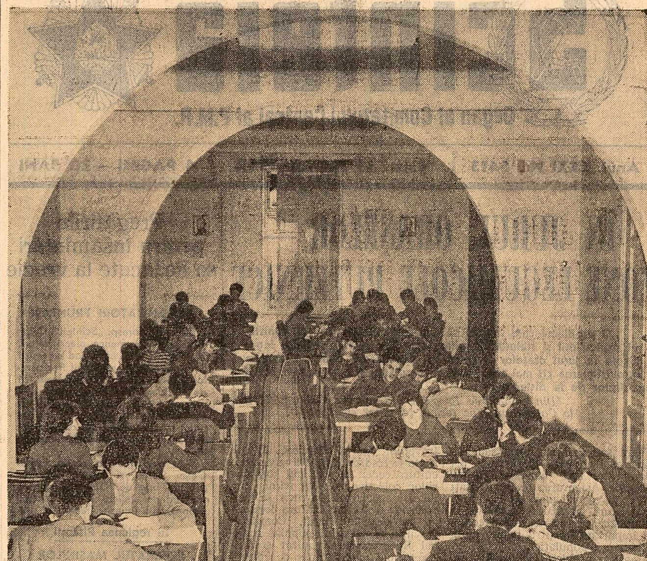
Biblioteca centrală regională din Brașov este vizitată de mulți cititori care găsesc aici un bogat fond de cărți, colecții de publicații, precum și ultimele noutăți editoriale, ziare și reviste. În fotografie: Una dintre sălile de lectură ale bibliotecii.