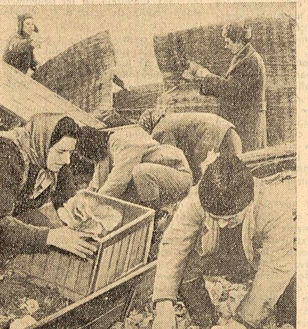
La G.A.S. Bragadiru-București a început recoltarea săculei din răsadnițe.

— Din răspunsul tov. vicepreședintelui, aflăm că aceste suprafețe sînt încă destul de mici față de posibilitățile existente. Este evident că planurile de dezvoltare a legumiculturii întocmite de organele locale nu au ținut seama de aceste posibilități.