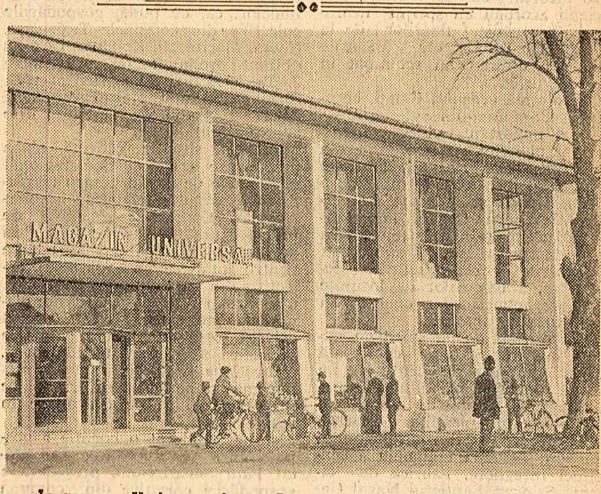
În comuna Vede, regiunea Argeș, a fost dat de curînd în folosință un nou magazin universal al cooperației de consum.

intre, înțelege s-o transmită cu aceeași seriozitate și pasiune schimbului următor. Ucenicul de ieri se pregătește astăzi pentru examenul de absolvire a clasei a XI-a la șerul și gîndurile îi se îndreaptă către băncile politice... Mulți de altfel dintre absolvenții școlii profesionale „Steagul Roșu” lucrează în uzină și urmează liceul șerul. Iar dintre absolvenții din ultimul deceniu unii au devenit maștrii, alții ingineri. Așa își crește mezinii familia metalurgistă.