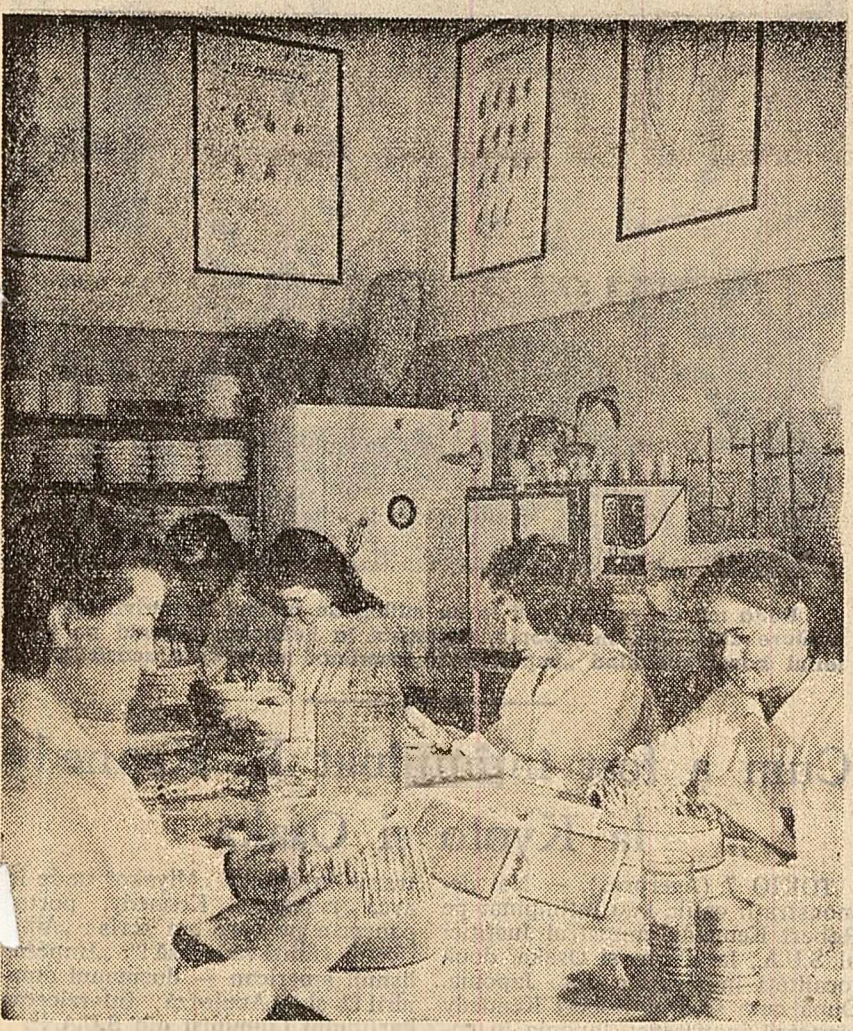
Folosirea unor seminte de calitate, cu o mare putere de germinatie, este una din condițiile de bază pentru obținerea de recolte mari. În fotografie: La laboratorul regional pentru controlul semintelor din București se cercetează rezultatele probelor de germinație.

Adunarea generală a Academiei de Științe a U.R.S.S.