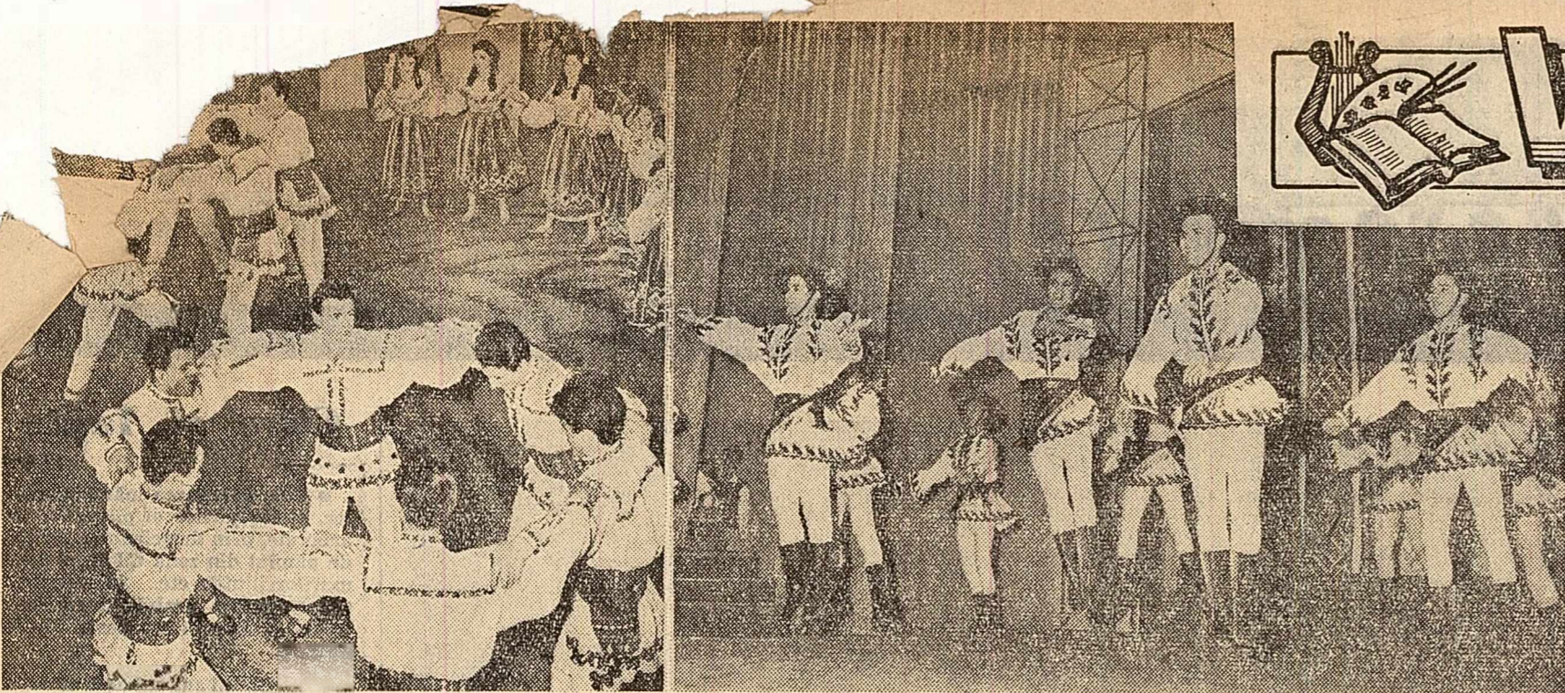
Scene din noul spectacol muzical coregrafic „București, inima țării”, a cărui premieră a avut loc ieri seară in interpretarea Ansamblului folcloric de cîntece și dansuri al Statului popular al Capitalei.