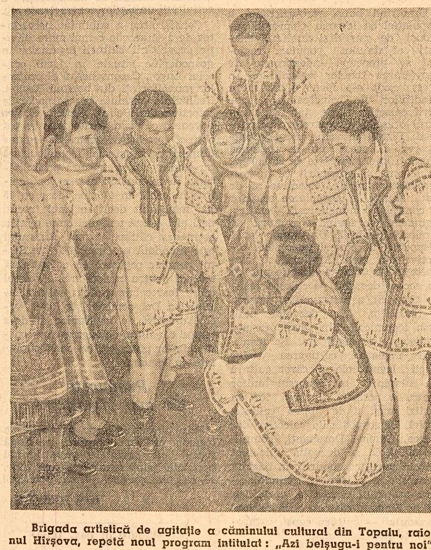
Brigada artistică de agitație a căminului cultural din Topalu, raionul Hirsova, repetă noul program intitulat: „Azi belșugu-i pentru noi”.

IURI DOLGUȘIN: Generatorul de minuni — roman științifico-fantastic. 556 pag. — 12,90 lei. (Ed. tineretului). BENNO PLUDRA: Șorțul Teddy — roman. 256 pag. — 6,65 lei. (Ed. tineretului).