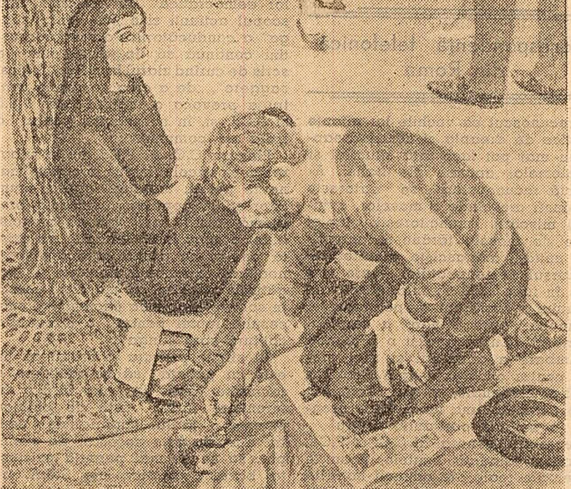
Deseri, la Paris se pot vedea pînă care lucrează pe asaltul trotuarelor. Unii trecători zîmbesc sceptic, alții fără măcar să privească se lucrează, aruncă o monedă și trec mai departe. Tabloul „Pietorii”, realizat de artistul plastic sovietic G. Korjev, redă adevărul amar al vieții oamenilor de artă în lumea capitalului.

● Premiul literar „Omega” pe anul 1961 a fost acordat în Italia scriitorului german Gunther Anders pentru lucrarea „Omul pe pod” („Der Mann auf der Brücke”). Edițiile precedente ale premiului au revenit scriitorilor Henri Alleg și Jean Paul Sartre. Lucrarea lui Gunther Anders este de fapt jurnalul unei călătorii în lucrurile ce mai păstrează încă urmele bombardamentelor atomice americane: Hiroșima și Nagasaki.