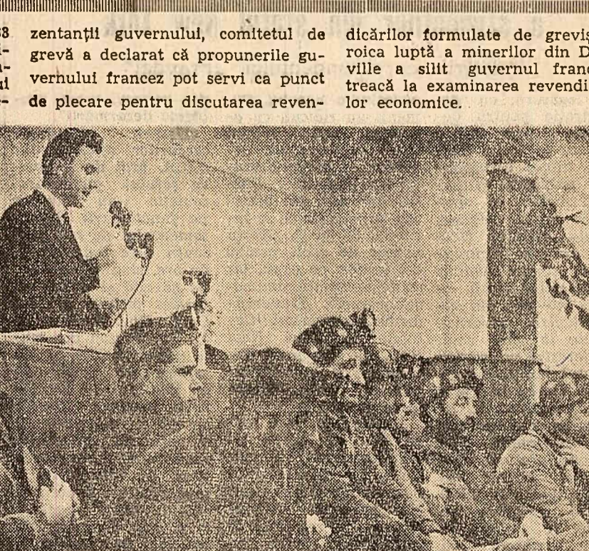
Aspect de la Conferința de presă a Comitetului Interindustrial care conduce greva minerilor de la Decazeville.