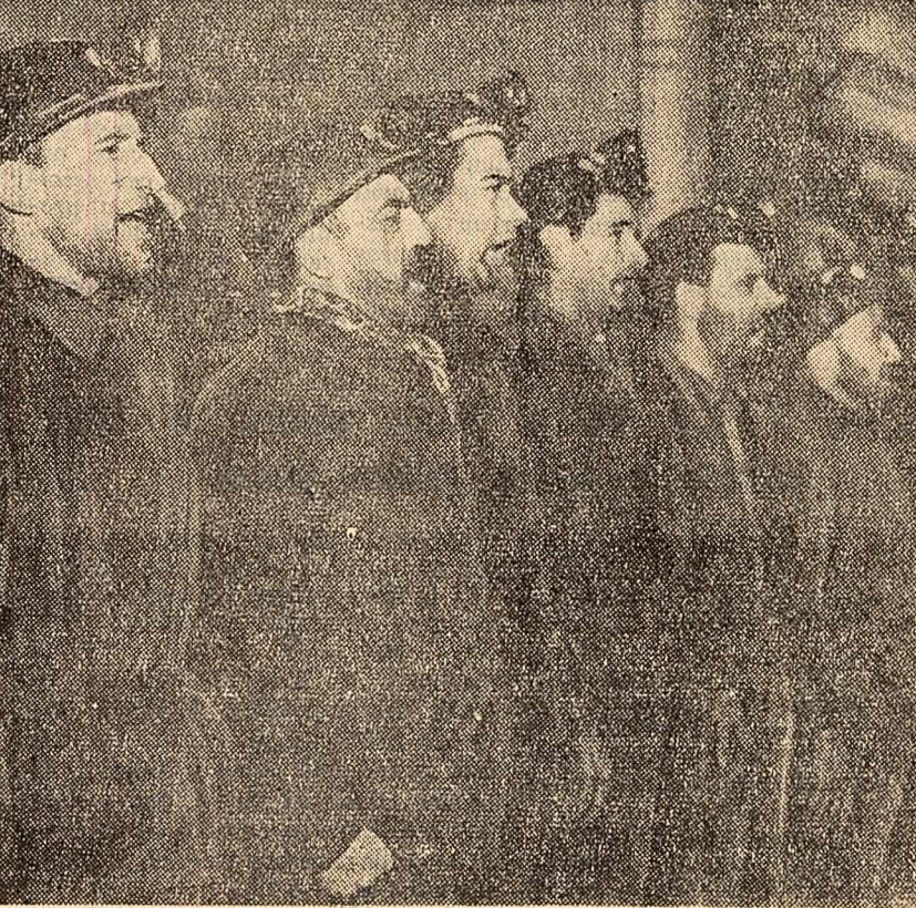
La sîrșitul conferinței de presă minierii delegați de greviști au citat „Marseliza” și „Internaționala”, ceea ce spunea mult despre morală greviștilor.