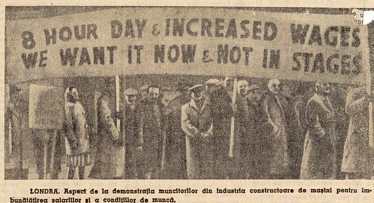
LONDRA. Aspect de la demonstrația muncitorilor din industria constructoare de mașini pentru îmbunătățirea salariilor și a condițiilor de muncă.

Politică de înghetare a salariilor a clarificat lucrurile pentru mulți muncitori care înțeleg acum mai bine legătura dintre reducerea nivelului lor de trai și povara chelieiilor de înarmare, precum și legătura dintre lupta lor economică și cauza reducerii încordării internaționale și apărării păcii.