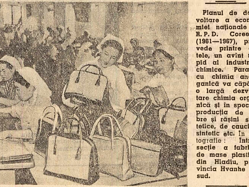
Plan de dezvoltare a economiei naționale a R. P. D. Coreene (1961-1967), prevede printre altele, un avînt rapid al industriei chimice. Paralel cu chimia anorganică va căpăta o largă dezvoltare chimia organică și în special producția de fibre și rășini sintetice etc. În fotografia: fabrică de materii plastice din Haidu, provincia Hvanhe de sud.

Se apropie de sfîrșit reconstruirea ofelării de la Combinatul metalurgic din Ozd. Re-