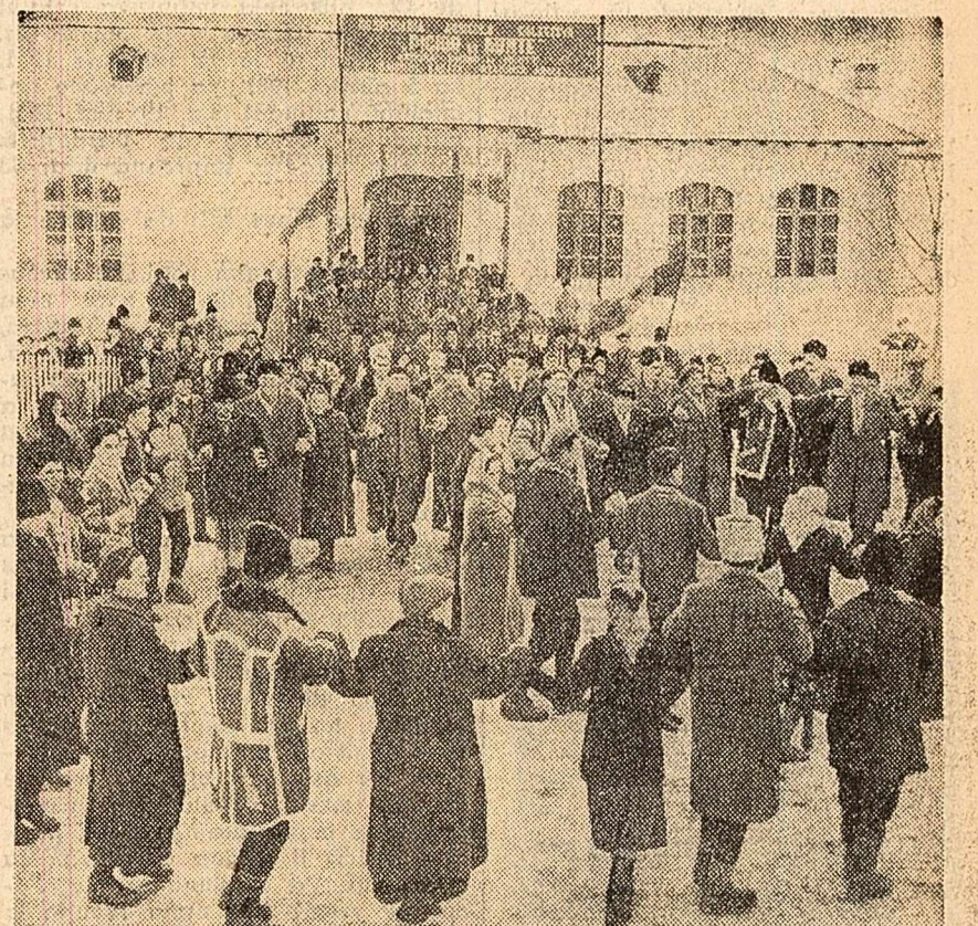
Duminică, în comuna Picior de Munte, din raionul Găești, s-a inaugurat o gospodărie colectivă în care au intrat 817 familii de țărani întovărășiți cu 1.859 hectare de pămînt — toți țărăni din comună. La adunarea de inaugurare ei au discutat despre unele probleme ale întreprinderii și dezvoltării gospodăriei colective. Pe lângă cultura cerealelor, noii colectiviști vor da o atenție deosebită plantărilor de pomi și viță de vie în terase. În fotografie: După inaugurarea gospodăriei, colectivitățile din Picior de Munte au înțins o horă.

66 DE DEPUTAȚI ȘI 4 MEMBRI LABURIȘTI AI CAMEREI LORZILOR au adresat un apel regelui Greciei, cerîndu-l anihilarea deșeurilor politice. Apelul atrage îndeosebi atenția asupra situației tragice în care se află 18