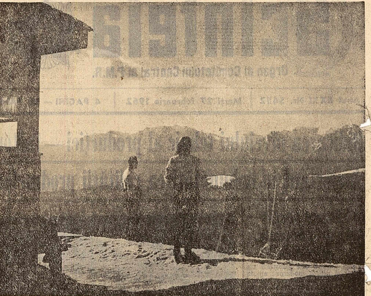
Cabana Clăbucel-plecare din Masivul Gîrbova.

SALA PALATULUI R.P. ROMINE (Teatrul Național „I. L. Caragiale”): BOLNAVUL ÎNCHEPUT (orele 19.30). TEATRUL DE OPERĂ ȘI BALET AL R.P. ROMINE: TRAVIATA (orele 19.30). TEATRUL DE STAT DE OPERĂ: LYSSISTRATA (orele 19.30). INSTITUTUL DE ARTĂ TEATRALĂ ȘI CINEMATOGRAFICĂ „I. L. CARAGIALE” (Sala Teatrului de Comedie): D-LEZ CARNAVALETUL (orele 20.00). TEATRUL SATIRIC MUZICAL „CĂTANEA” (Sala Savoy): REVISTA 6 (orele 20.00). (Sala Victoriei nr. 174): CONCERT ÎN RE... HAZILU (orele 20.00). ANSAMBLUL DE CINTECĂ ȘI DANȘURI AL C.C.S. „DRAG MI-Î CINTECUL ȘI JOCLUL” (orele 20.00). CINEMATOGRAFE: Filmul documentar NIKITA SERGHEEVICI HRUȘCIO rulează la cinematograful Munca (16.15; 20.30). STRĂZILE AU AMINTIRI (16.15; 20.30). MĂȘTERII (16.15; 20.30). G. COȘBUC (16.15; 20.30). FLOAREAȘTEA (16.15; 20.30). PACE NOULUI VENIT (16.15; 20.30). INVITATIE LA PATINĂ (16.15; 20.30). MĂȘTERII (16.15; 20.30). LUMINA (16.15; 20.30). LIBERTĂȚII (16.15; 20.30). DRAGOSTEA LUI ALIOSA (16.15; 20.30). M. GORJI (16.15; 20.30). ÎNTRĂRITRE ÎNTRE POPARE (cinemascop - 16.15; 20.30). MOTOIȘII (16.15; 20.30).