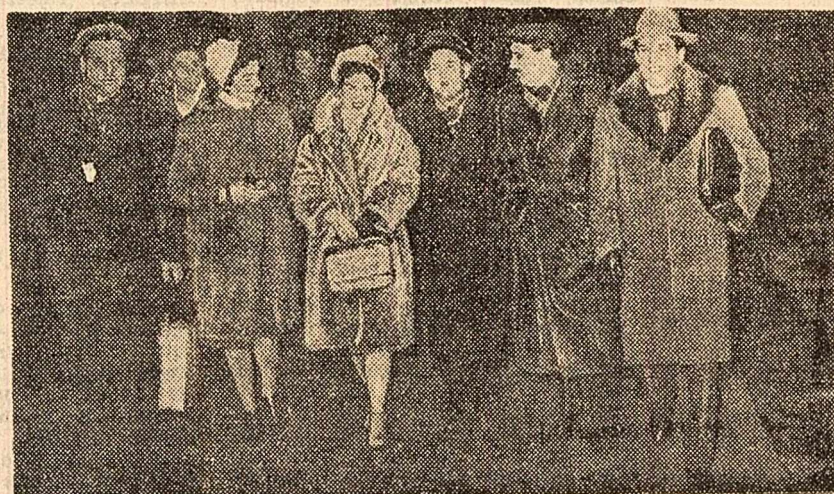
Artiști ai circului sovietic la seștea în Gara de Nord