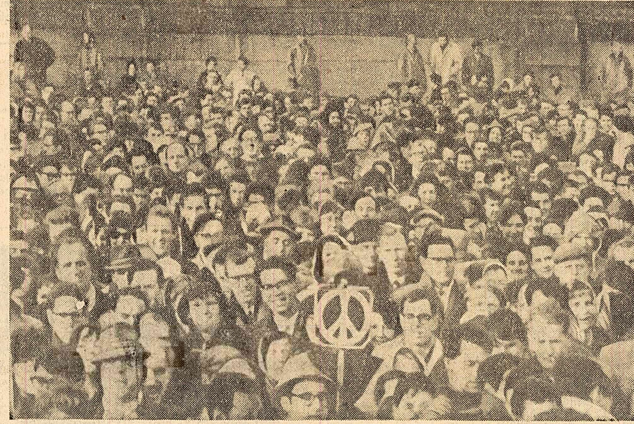
Mii de londonezi s-au adunat în piața Trafalgar pentru a protesta împotriva curselor înarmărilor nucleare.