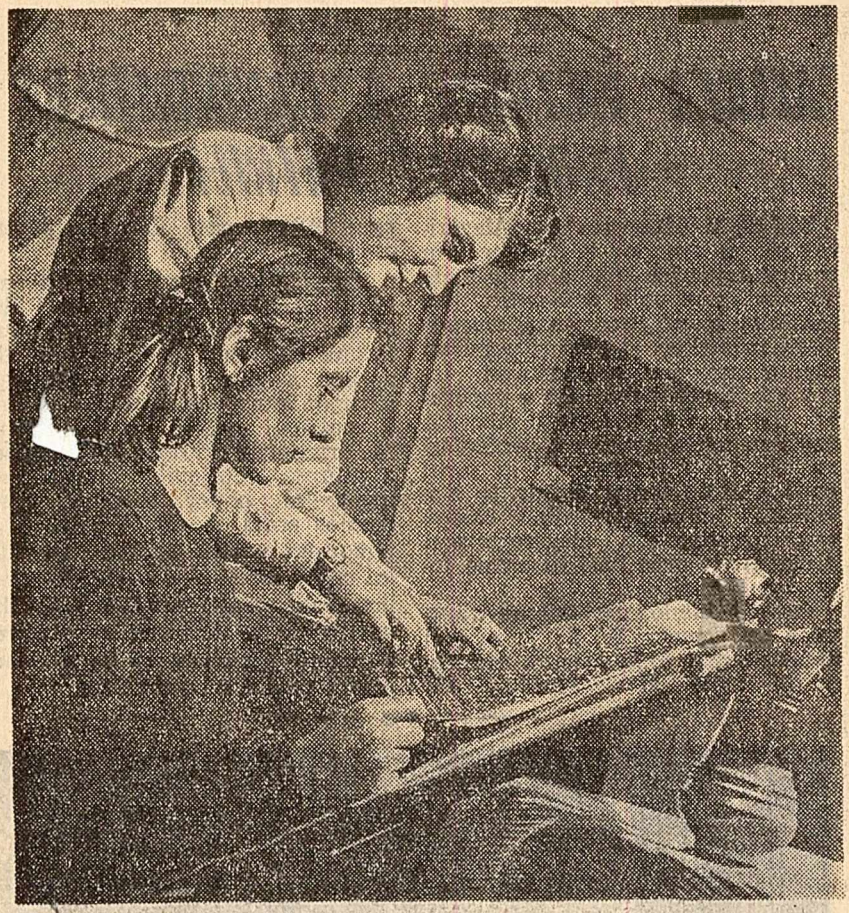
Școala populară de artă din Brăila. Numeroși muncitori de uzină din localitate, elevi, funcționari își însușesc act cunoștințe de pictură, coregrafie, actorie, cântă, pian, vioară etc. Fotografia redă un aspect de la o lecție în clasa de cusături și țesături.