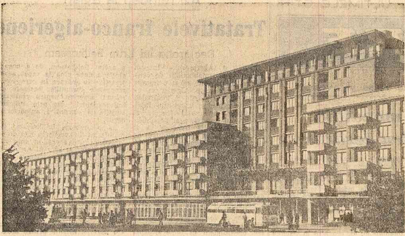
Din noul peisaj al orașului Ploiești.