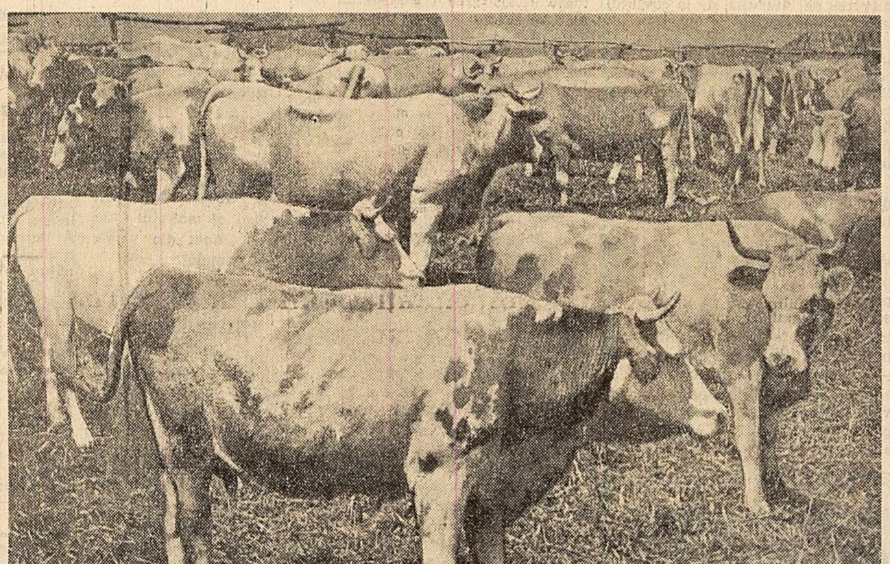
Print-o îngrijire bună și o furajare rațională, colectivizii din Hoșlig-Sighișoara au realizat anul trecut o producție medie pe cap de vacă furajată de 2.701 litri lapte.