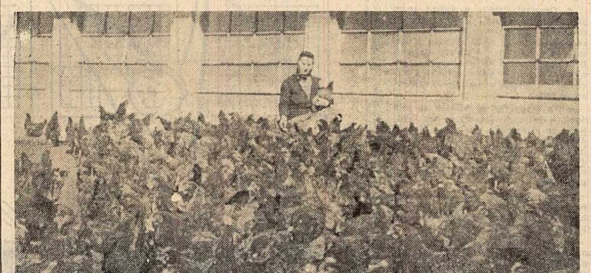
La ferma de păsări a gospodăriei colective „9 Mai” din Cisnădoara, raionul Sibiu.

Cum reușim noi să obținem asemenea rezultate? De la bun început trebuie să arătăm, conștient și în mod clar, că vom avea la dispoziție o forță de muncă bine calificată și o organizare bună a muncii.