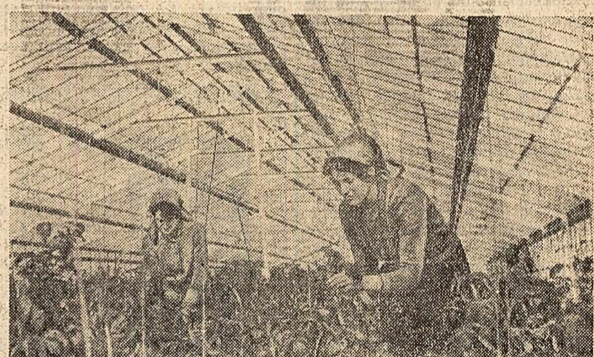
Serele gospodăriei agricole colective din Codelca.