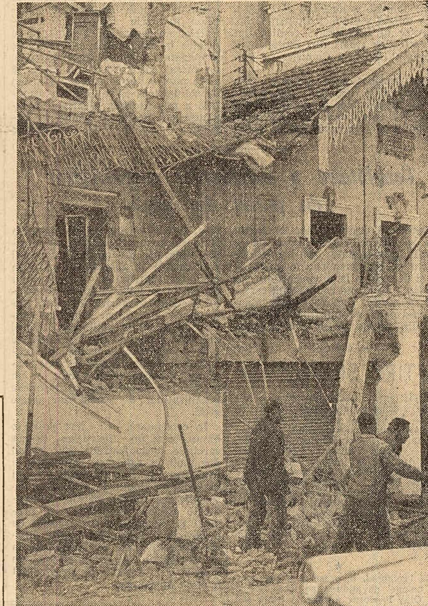
ALGER. Urmele unei explozii provocate de bandele O.A.S.

ALGER 24 (Agerpres). — Potrivit relatărilor agenției France Presse, în Algeria situația se menține încordată ca urmare a activității teroriștilor din O.A.S. În Alger cartierul Bad-el-Oued continuă să rămînă complet izolat și unitățile de poliție și trupe efectuează percheziții în fiecare casă. Simbătul a fost înregistrat schimburi sporadice de focuri în acest cartier. În ultimele 24 de ore au fost arestați 50 de membri ai O.A.S. refugiați în acest cartier. Simbătul seara agenția France Presse relatează că în cursul după-amiezii grupuri de teroriști O.A.S. au atacat cu grenade autocamioane transportînd trupe franceze, precum și sediul local al statului major al armatei franceze din cadrul Algerului. La Oran ultracolonialiștii continuă să exercite controlul asupra unor cartiere întregi ale orașului. În alte orașe algeriene — Guelville, Pointe Pescade și Sidi bel Abbas — O.A.S. a săvîrșit spargeri de bănci, furturi de arme, a pus la cale atentate cu bombe.