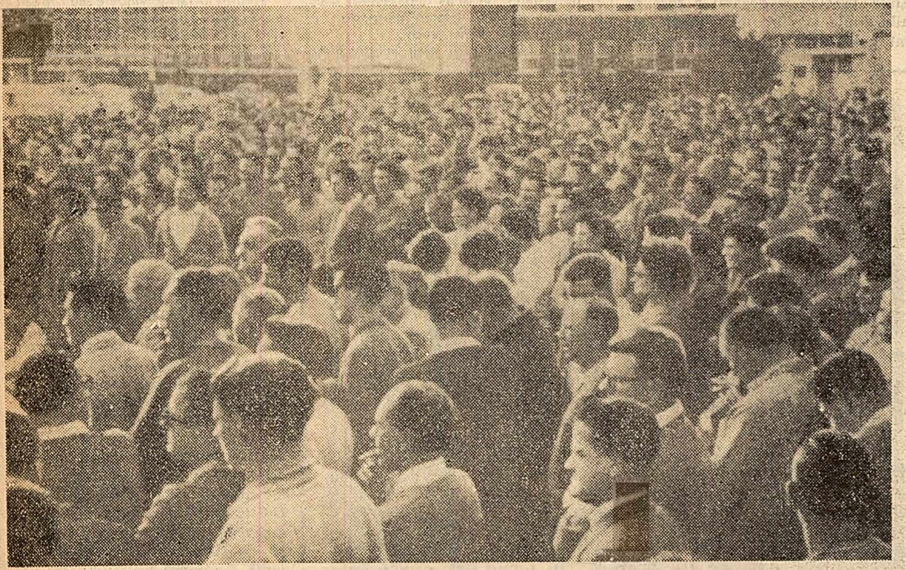
Aspect de la un miting al șomerilor în orașul australian Sidney.

LONDRA. Comitetul executiv al Sindicatului muncitorilor din transporturi din Scoția, care reunește 20.000 de muncitori, a protestat pe lângă ambasada americană la Londra împotriva persecutării Partidului Comunist din S.U.A. În protestul său, Comitetul executiv a arătat că represaliile împotriva Partidului Comunist din S.U.A. sînt în contradicție cu principiile democratice.