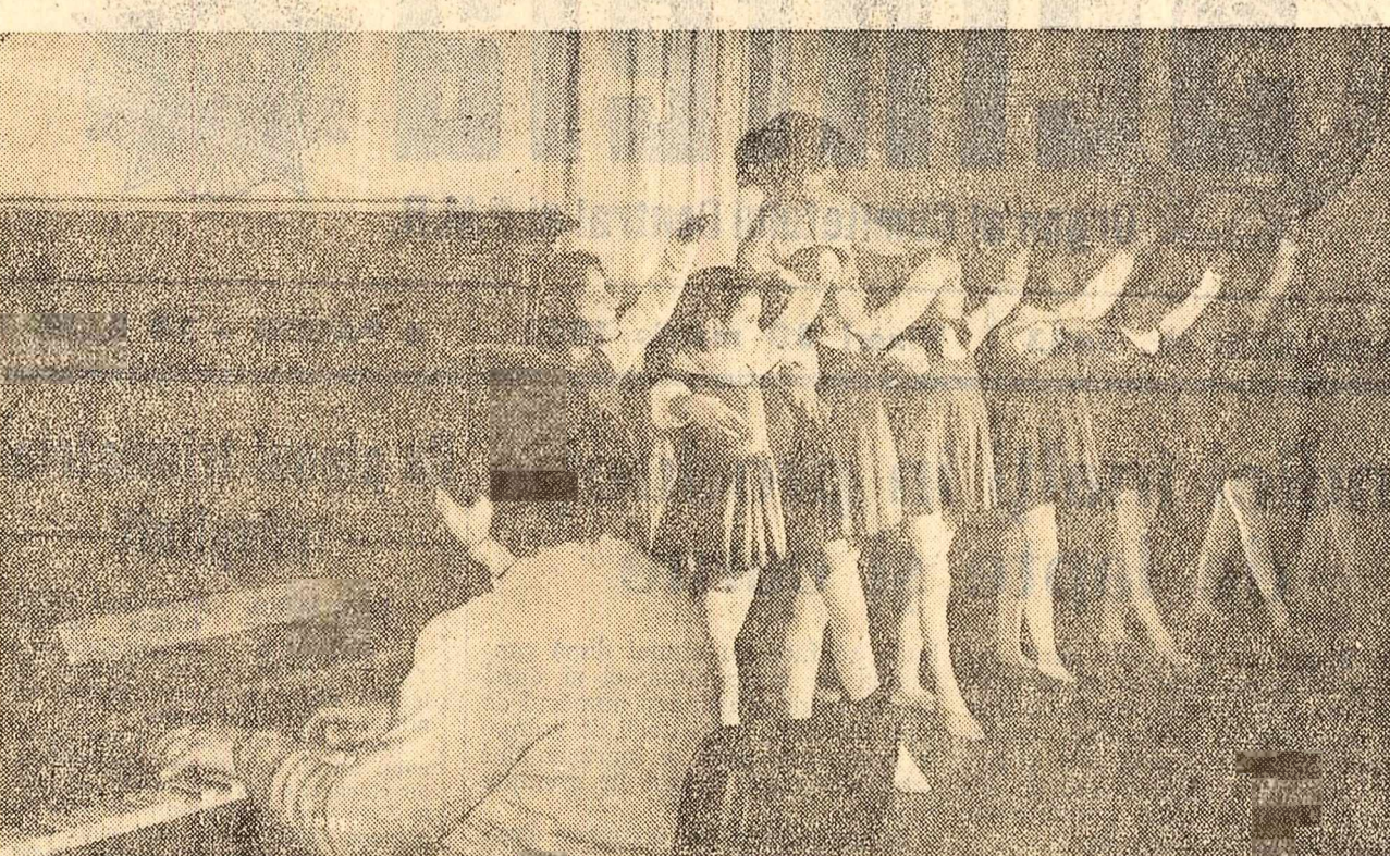
Primii pași (La cercul de balet al Casei de Cultură a sindicatelor din Craiova).