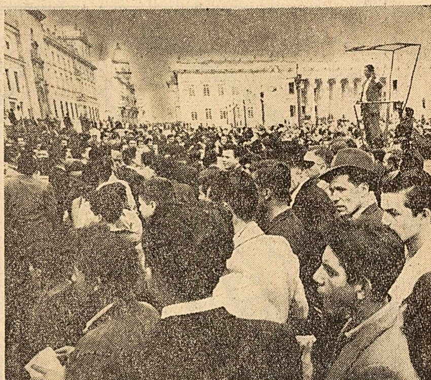
Meetingul greviștilor din transportul în comun din Bogota (Columbia) care, în ciuda măsurilor polițienești s-a desfășurat cu succes.