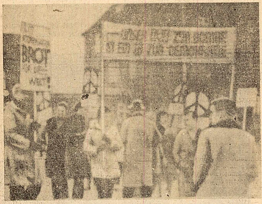
Tineretul din Hamburg participă în mare număr la o demonstrație împotriva înarmării Bundeswehr-ului cu arme atomice.

COPENHAGA 31 (Agerpres). — Membrii organizației pacifiste „Impotriva războiului” au desfășurat o demonstrație în piața centrală a orașului Aalborg, mare centru industrial din Danemarca. Timp de 40 de ore, demonstrații au purtat pancarte cu lozinci pentru apărarea păcii și reducerea cheltuielilor militare. Demonstrații au împărțit manişete chemând la luptă pentru pace.