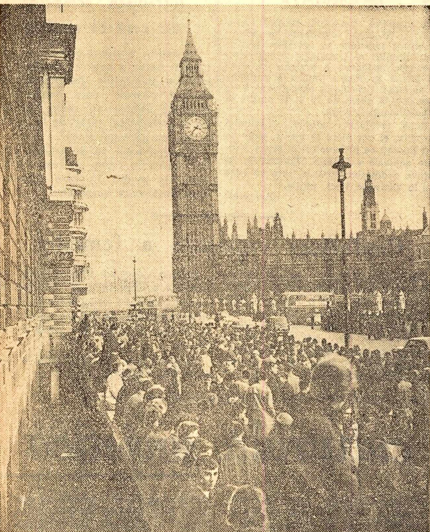
Manifestație la Londra, în fața parlamentului, împotriva experiențelor nucleare.