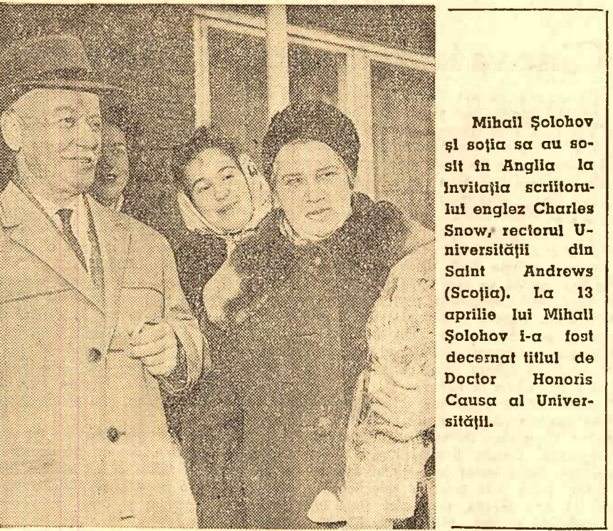
Mihail Șolohov și soția sa au sosit în Anglia la invitația scriitorului englez Charles Snow, rectorul Universității din Saint Andrews (Scoția). La 13 aprilie lui Mihail Șolohov i-a fost decernat titlul de Doctor Honoris Causa al Universității.