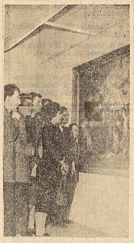
Muzeul de artă al R. P. Romînia a fost vizitat ieri de numeroși bucureșteni și excursioniști din provincie. În fotografie: Un grup de studenți de la facultatea de filozofie admirînd tabloul lui Theodor Aman, „Boierii surprinși la ospățul de trimiși lui Vlad Tepeș”.