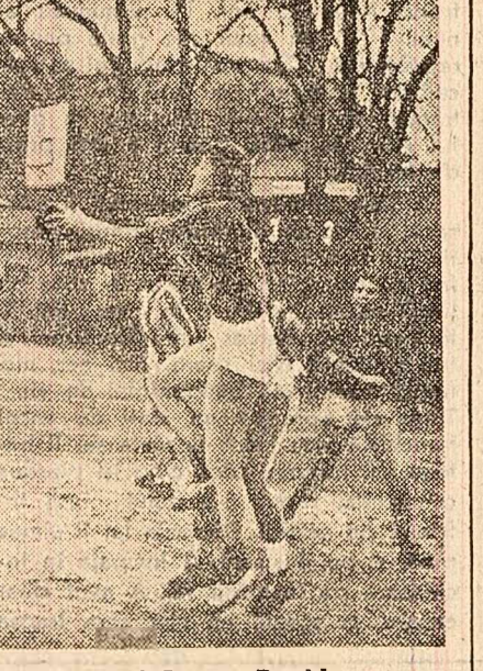
Un aspect din timpul jocului Tractorul Brașov-Rapid.