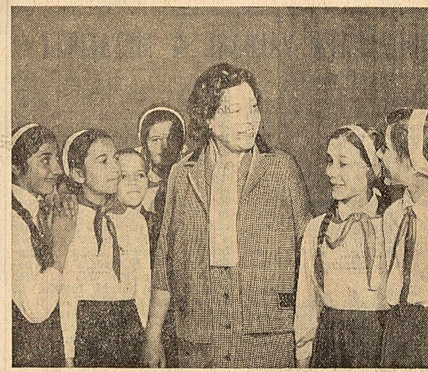
Ieri, la casa de cultură a tineretului din raionul Grivița Roșie, peste 600 de pionieri din clasele V—VII au participat la adunarea tematică „Construcții și orase noi pe harta patriei”. Ei au ascultat o expunere despre noile cartiere care s-au născut în ultimul timp în Capitală, despre tinerele orașe Victoria și Uricani, despre noile construcții industriale ale Hunedorei și Galațiului. Copiii au văzut și două filme documentare „Cronică hunedoreană” și „Aspecte din viața satelor noastre”. În fotografie: Un grup de pionieri, împreună cu profesora lor, care au participat la această adunare.