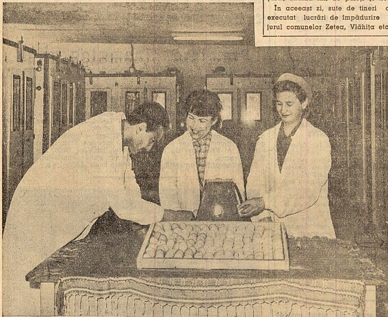
De la începutul anului, stațiunea de incubație a G.A.S. „Mihail Kogălniceanu”, regiunea Dobrogea, a livrat gospodăriilor de stat și colective din regiune peste 130.000 de pul. În fotografie: Inginerul și operatorii fac selecționarea ouălor încalțate de a fi introduse în incubator.

În zilele următoare, pe măsură ce va permite timpul, trebuie să se treacă cu toate forțele la semănatul porumbului. În acest scop este necesar să se identifice toate suprafețele mai zăvinate, care pot fi lucrate mai ușor, întrucât în primăvara aceasta, cu ploii numeroase, perioada de semănat s-a scurtat foarte mult, oamenii muncii din agricultură și mecanizatorii, colectivii, lucrătorii din gospodăriile de stat — să nu precupețească nici un efort pentru a asigura succesul lucrărilor agricole. Grăbirea semănatului la porumb este în momentul de față sarcina cea mai importantă în campania agricolă de primăvară.