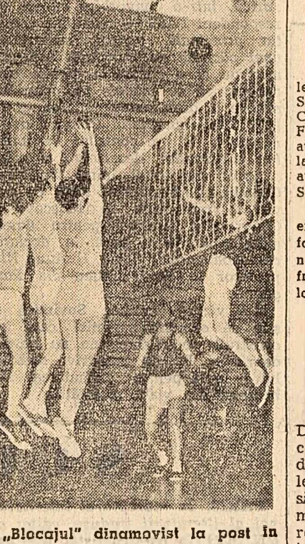
„Blocajul” dinamivist la post în meciul cu Olimpia-București.

Alte rezultate: Știința Timișoara - Farul Constanța 3-0; Dinamo București - Olimpia București 3-2.