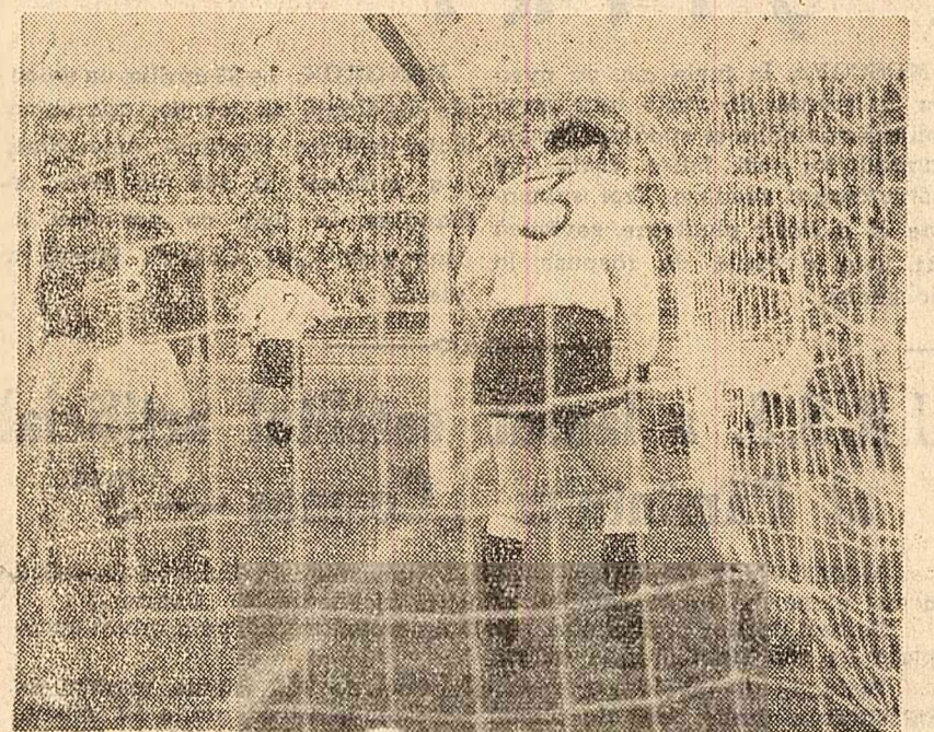
Al treilea gol...

Mecul dintre selecționata Brasov și echipa R. P. Polone s-a terminat cu un rezultat de egalitate - 2-2.