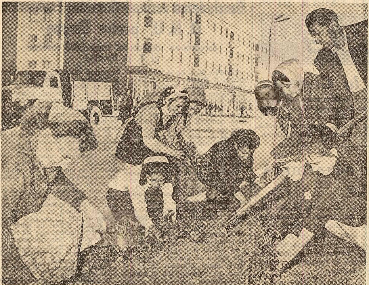
Imagine de primăvară la Onești: plantatul florilor în fața noilor blocuri