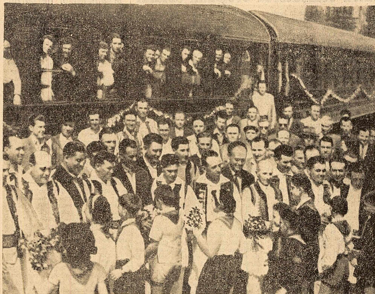
Ieri după-amiază, sute de reprezentanți ai colectivizatorilor din regiunea Banat, invitați la sesiunea extraordinară a Marii Adunări Naționale, au plecat cu trenul spre București. În gara Timșoara li s-au înmănat flori de către un grup de pionieri.