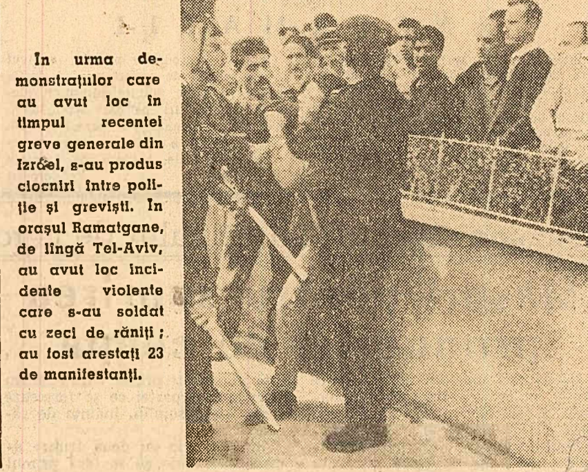
În urma demonstrațiilor care au avut loc în timpul rețelei greve generale din Izrael, s-au produs ciocniri între poliție și greviști, în orașul Ramatgan, de lângă Tel-Aviv, au avut loc incidente violente care s-au soldat cu zeci de răniți; au fost arestați 23 de manifestanți.