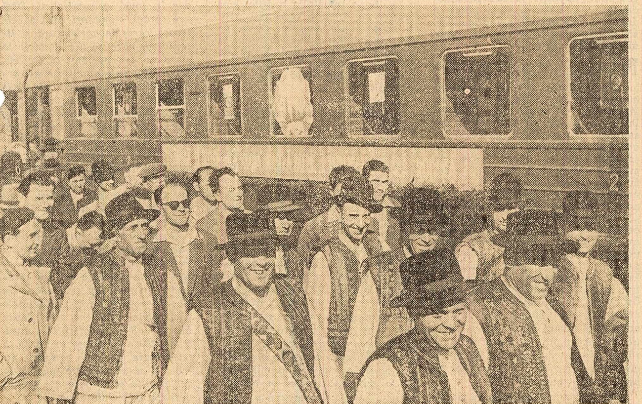
Deputați și invitați la Sesiunea extraordinară a Marii Adunări Naționale sosiți în Capitală (stînga sus — regiunea Iași; stînga jos — regiunea Maramureș; dreapta — regiunea Cluj).