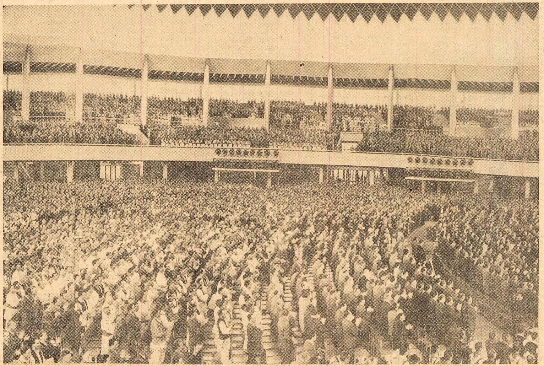
În timpul lucrărilor sesiunii.