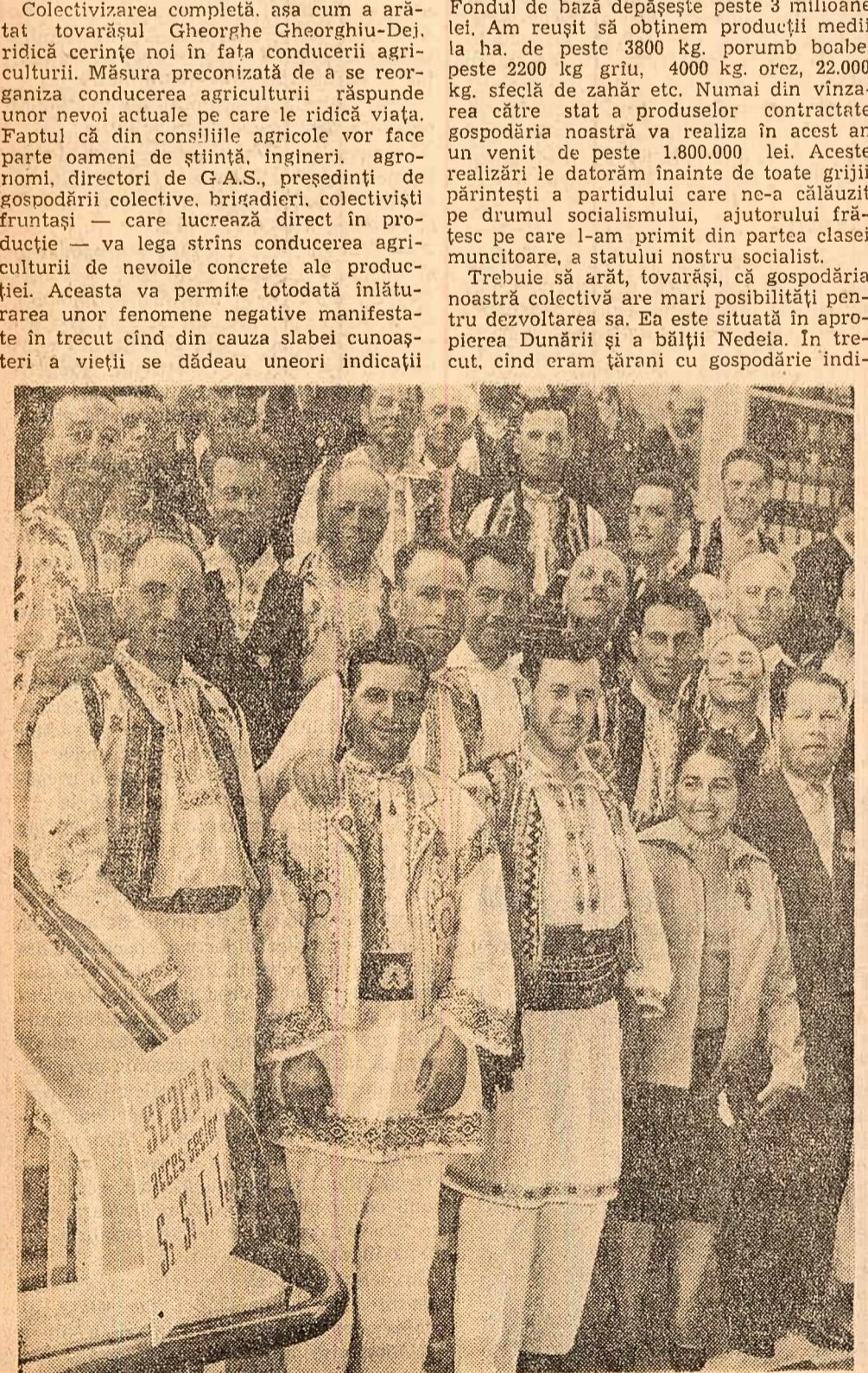
Un grup de participanți din regiunea Bacău la lucrările sesiunii.