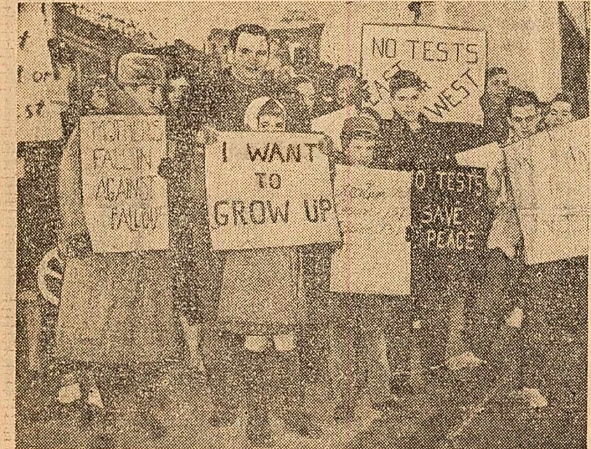
Holăreala S.U.A. de a relua experiențele nucleare în atmosferă a stîrnit un val de proteste în lumea întreagă...

U Thant se pronunță pentru crearea unor zone neutre