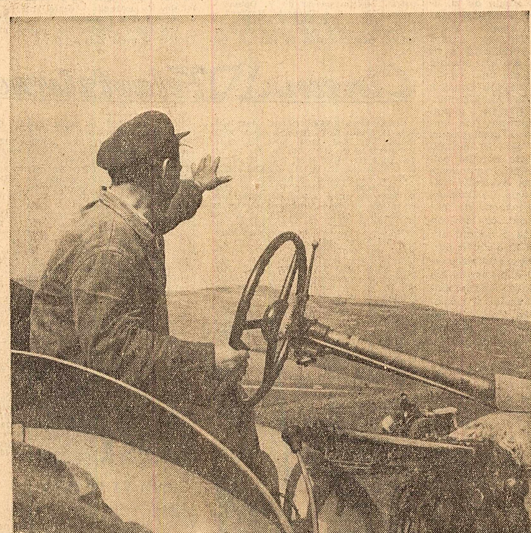
Pe ogarele gospodăriei colective din Apahida, regiunea Cluj

Conducerea Casei de cultură s-a îngrijit din timp și de înlocuirea unui bogat program. În stațiune vor da spectacole o serie de formații artistice profesioniște și de amatori din București, Brașov, Sf. Gheorghe etc.