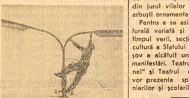
Roșiorii de Vede. Se instalează lămpi pentru iluminatul fluorescent.

BRASOV (cosp. „Scinteia”). — În timpul verii, în frumoasele localități de munte din regiunea Brașov vor sosi să-și petreacă vacanța circa 8.000 de pionieri și școlari din București și din diferite regiuni ale țării. La vile și taberele de la Timișul de Sus, Bran, Zimbruș, Săliște și în alte părți au început, încă de pe acum, pregătirile. Se lucrează la repararea și zugrăvirea camerelor, se verifică instalațiile de apă caldă, încălzire și sanitară, se completează mobilierul, lenjeria etc. Se fac și lucrări de înfrumusețare. În parcurile și aleile din jurul vilor se plantează flori și arbuști ornamentali.