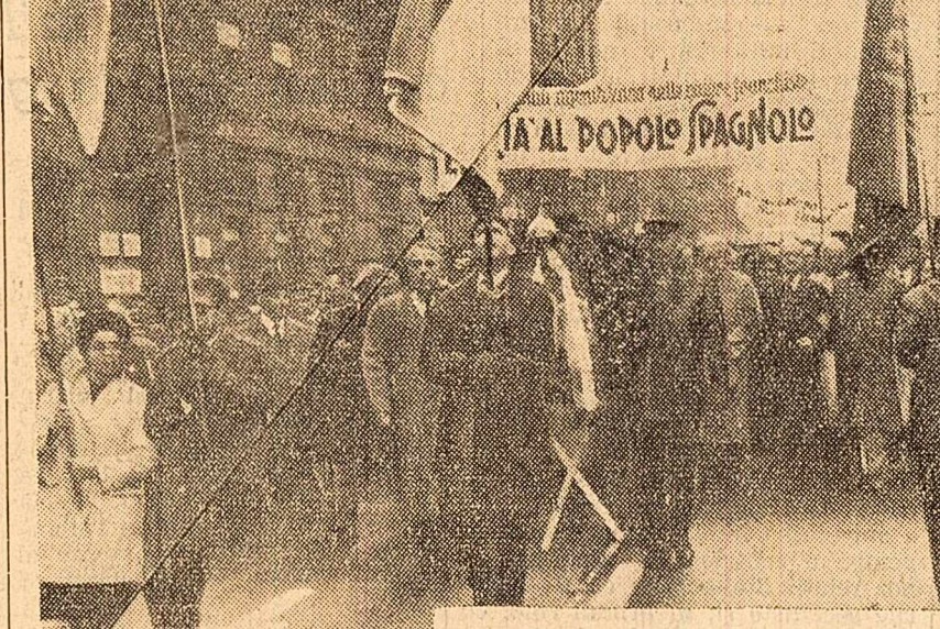
GENOVA. Peste 20.000 de oameni ai muncii au participat la o demonstrație de solidaritate cu lupta poporului spaniol. Printre demonstrații se aflau numeroși delegați străini la întâlnirea internațională de la Roma pentru eliberarea poporului spaniol.

În fața frontului unit al muncitorilor, patronii sînt nevoiți să bată în retragere. Direcția uzinelor metalurgice „Duro Felguera” (provincia Gijon) a fost obligată să facă concedii celor 1.500 de muncitori, semnând un nou contract colectiv care prevede mărirea salariilor. De dimineața, în Asturia la mina „El Langreo și Nalon, muncitorii au luat lucrul în urma acțiunilor lor, către patronat a revenit