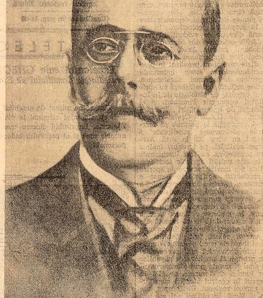
I. L. CARAGIALE