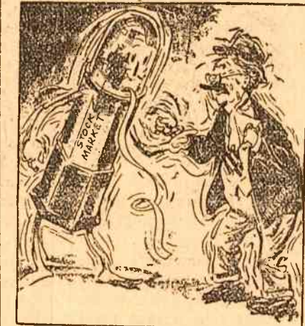
„Termină cu tremuriciul!” își spun unul altuia „Bursa de acțiuni” și „investitorii” care sînt cuprinși de panică în urma scaderilor de la Bursa din New York. Astfel întâlțsează situația caricaturistă Crockett în ziarul „Washington Star”.

În zilele noastre, popoarele sînt hotărîte să înăduie tot ce-i vechi și perimat, să lupte pentru triumful libertății, progresului și păcii.