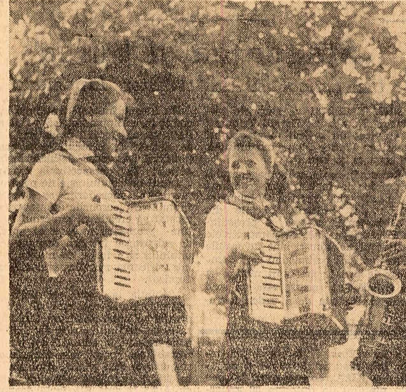
O ultimă repetiție înainte de spectacolul pe care acești elevi — fii ai colectivității din comuna Urechești-Focșani — l-au pregătit pentru Ziua internațională a copilului.

Pe scena Casei de cultură a sindicatelor din Craiova a fost prezentat miercuri după-amiază un spectacol festiv pentru copii dat de cercurile de bale, vioară, acordeon și pian ce funcționează pe lângă această instituție.