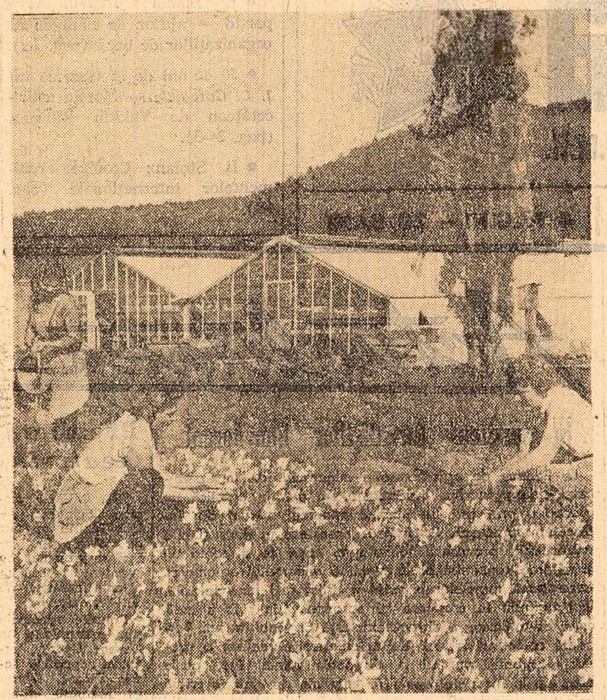
Una din preocupările membrilor gospodăriei colective „Drum nou” din comuna Cristian, regiunea Brașov, este și cultivarea florilor.