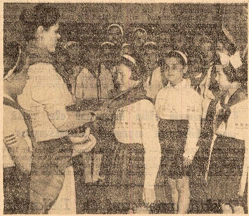
O nouă promoție de pionieri. Cu prilejul Zilei internaționale a copilului, elevii frontașii la învățătură de la Școala nr. 5 din Capitală primesc cravatele roșii de pionieri.

În cinstea Zilei internaționale a copilului, comisiile de femei în colaborare cu comitetele de stradă din Capitală au inițiat o serie de acțiuni. Astfel, în raionul 1 Mai s-au amenajat 4 spații verzi cu locuri de joacă pentru copii.