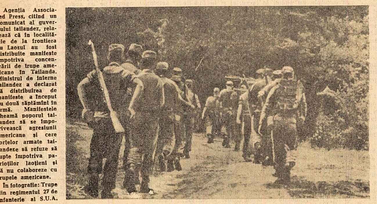
Agencia Associated Press, citind un comunicat al guvernului tailandez, relatează că în localitățile de la frontiera cu Laosul au fost distribuite manifeste împotriva concentrării de trupe americane în Tailandă. Ministrul de Interne tailandez a declarat că distribuția de manifeste a început cu două săptămîni în urmă. Manifestele cheamă poporul tailandez să se împotrivescă agresiunii americane și care forțelor armate tailandez să refuze să lupte împotriva partiturilor laolalt și să nu colaboreze cu trupele americane.

PEKIN 2 (Agerpres). — După cum anunță agenția China Nouă, în zilele de 21—29 mai a avut loc la Pekin consătuirea în legătură cu munca în rândul minorităților naționale, convocată de Comisia națională a Adunării Reprezentanților Populari din întreaga China și de Comitetul pentru problemele naționalităților. La consătuire s-a făcut bilanțul activității desfășurate în ultimii ani în rândul minorităților naționale din China și au fost, de asemenea, discutate sarcinile de viitor.