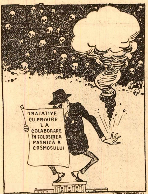
Intre vorbe și fapte... Desen de B. EFIMOV din ziarul „Izvestia”