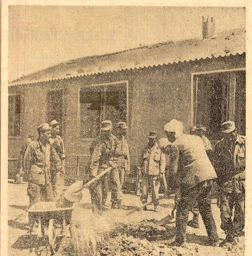
În apropiere de Souk Arras (Algeria), acolo unde a fost un lagăr de concentrare, în colibe și bordole, au trăit aproximativ 6000 de algerieni deținuți. Sute de familii au rămas pe locul fostului lagăr și construiesc acum un sat. Soldații din Armata de eliberare ajută pe foștii deținuți, acum eliberați, la construcția caselor, școlilor, unităților sanitare. În fotografie: se construiește un centru sanitar.

ALGER 5 (Agerpres). — Bilanțul crimelor O. A. S. comise duminică pe teritoriul Algeriei comunicat de agenția France Presse este de 11 morți și 12 răniți. De asemenea, au fost semnalate explozii de bombe și un incendiu la un depozit de produse din cauciuc, precum și atacul comis de un grup de ultracoloniști la sediul întreprinderii de transporturi din Alger. O.A.S.-iștii și-au continuat șirul crimelor și luni. Agenția France Presse subliniază că în această zi