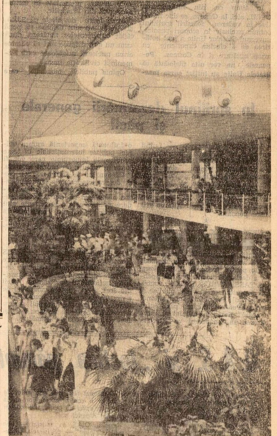
În clădirea principală a Palatului pionierilor — „Grădina de Iarnă”.

WASHINGTON 8 (Agerpres). — Ministerul Muncii al S.U.A. a făcut cunoscut că în luna aprilie în Statele Unite au avut loc 460 greve la care au participat 155.000 persoane.