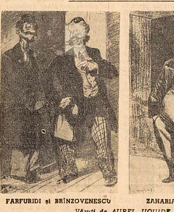
FARFURIDI și BRINZOVENTESCU Văzuți de AUREL JIQUIDE

mai mult decât oricînd, scrierul lui Caragiale. Reeditarea operii sale în tiraje fantastice, prezența continuă a pieselor sale pe scenele teatrelor, mulțimea studii și articolelor care-i sînt închinată, devoțiunea cu care mil de echipe artistice de amatori își joacă piesele sau își transpun pe scenă schițele, toate acestea nu se datoresc doar unui respect posesiv. Caragiale este un scriitor contemporan, care trăiește odată cu noi, militînd pentru fătura unei conștiințe superioare.