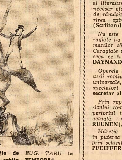
Ilustrație de EUG. TARU la schița „TEMPORA“

Opera lui Caragiale fac parte din tezaurul culturii romine și totodată din patrimoniul literaturii universale, ele fiind tuzite de numeroși cititori și spectatori din lumea întregă. (CEN BEICEN, secretar al Uniunii Scriitorilor din R. P. Chineză).