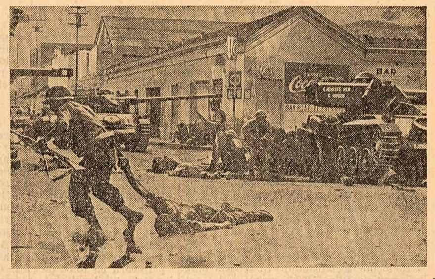
Răscola izbucnită la cea mai mare bază maritimă-militară a Venezuelei — Puerto-Cabello, a fost crunt înăbușată de forțele guvernamentale. Au avut loc lupte grele între răsculații și forțele de represie. În clipă: Aspect al luptelor într-un cartier al orașului Puerto-Cabello.

NAȚIUNILE UNITE 16 (Agerpres). — Într-un interviu acordat corespondentului agenției Associated Press, Joshua Nkomo, președintele Uniunii populare africane Zimbabwe din Rhodesia de sud, a declarat că este de neconceput ca cele trei milioane de africani din această colonie să mai suporte măcar pentru un an dominația celor 450.000 de coloniști albi. Propunerea britanică de menținere a regimului colonial pentru încă 9-12 ani pînă cînd africanii vor fi, chipurile, capabili să se autoguverneze este o absurditate. Dirința noastră de libertate este atât de puternică încît nici o forță nu ne poate sili să rămînem sub jugul colonialiștilor, și colonialiștii știu acest lucru”, a spus Nkomo, exprimîndu-și totodată speranța că Adunarea Generală a O.N.U. va adopta o rezoluție care să recunoască dreptul la independență al poporului african din acest teritoriu.