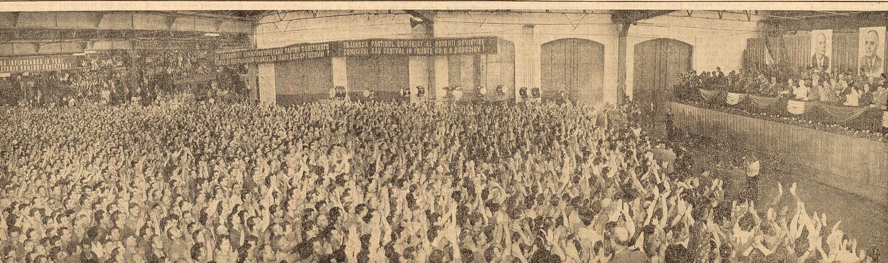
Aspect de la mîntul oamenilor muncii de la uzinele „Grivița Roșie”

În paginile II și III: MİTINGUL DE LA UZINELE „GRIVIȚA ROȘIE” DIN CAPITALA Cuvîntările tovarășilor GH. GHEORGHIU-DEJ și N. S. HRUȘCIOV (Continuare în pag. III-a)