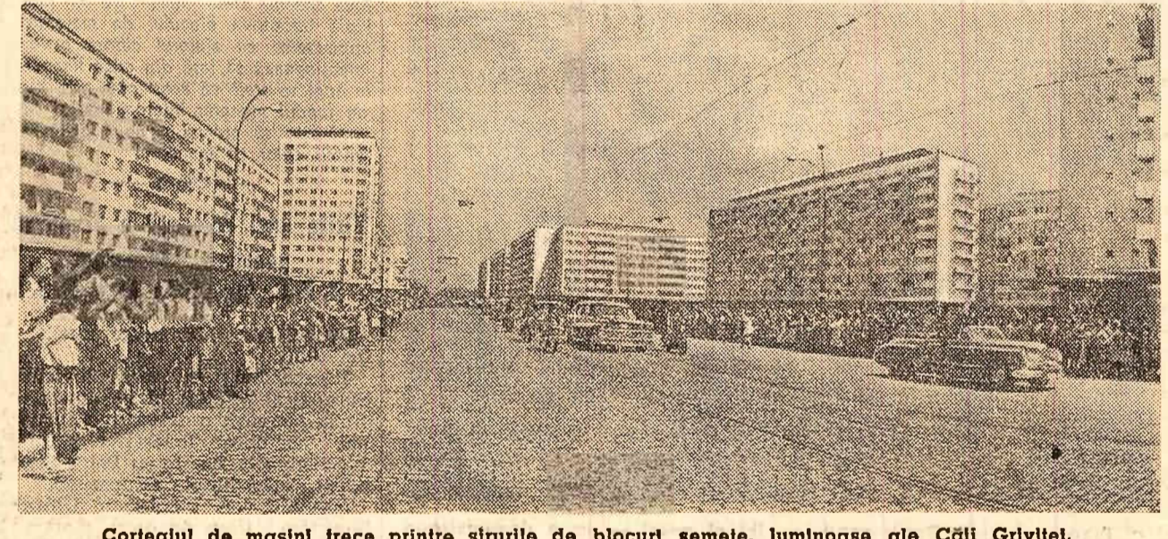
Cortegiul de mașini trece printre șirurile de blocuri semeie, luminoase ale Căii Grîviței.

Imperialiștii americani ar dori să schimbe raportul de forțe în lume în favoarea lor. Ei ar dori ca noi să reducem cheltuielile pentru apărare. Putem accepta aceasta? Nu, nu putem. Recent, în Uniunea Sovietică s-a ivit următoarea problemă: Statul vindea populației carne la prețuri mai scăzute decît cele cu care o cumpăra de la colhozuri, adică carnea era vîndută la un preț mai scăzut decît costul ei. Acest preț nu compensa cheltuielile de muncă de-depus de colhoznici în producția de carne. Vă dați singuri seama că într-o asemenea situație creșterea animalelor nu poate să se dezvolte cu succes.