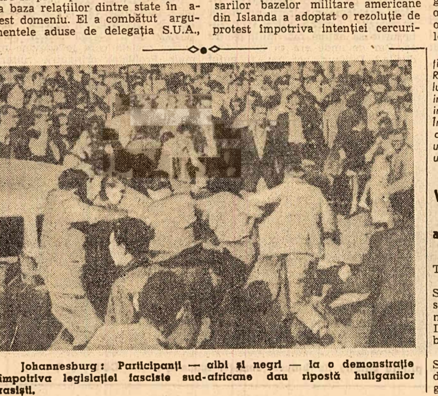
Johannesburg: Participanți — albi și negri — la o demonstrație împotriva legislației fasciste sud-africane după ripostă hulanțioasă rasistă.