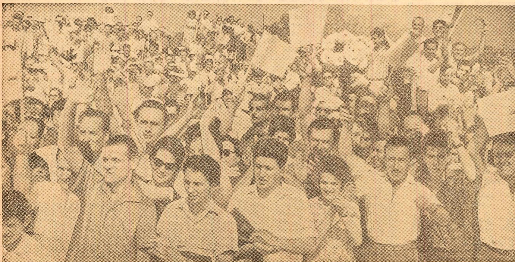
Căldărenii Capitalei adunăți pe aeroportul Băneasa ovăzionază pentru prietenia romîno-sovietică