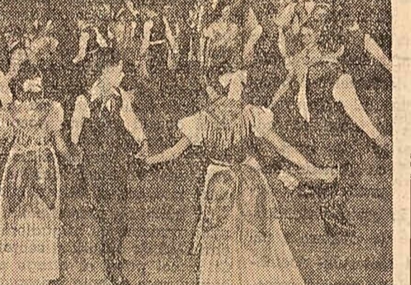
In primele zile ale lunii a avut loc la zona regionala...