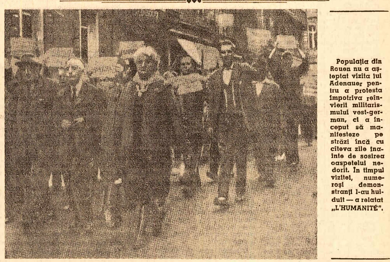
Populația din Rouen nu a acceptat vizita lui Adenauer pentru a protesta împotriva reînviului militarismului vest-german...