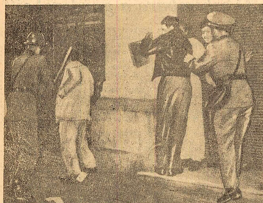
Soldaii peruveni brutalizînd cetățenii care au protestat împotriva loviturii de stat militare pusă la cale de reacțiunea din Peru.

La Paris se urmărește cu atenție evoluția evenimentelor din Algeria. A. Peyrefitte, secretar de stat pentru problemele informațiilor al guvernului francez, a declarat, potrivit agenției France Presse, că „dacă situația din Algeria se va înrăutăți, „Franța va interveni direct pentru a-și apăra cetățenii”.