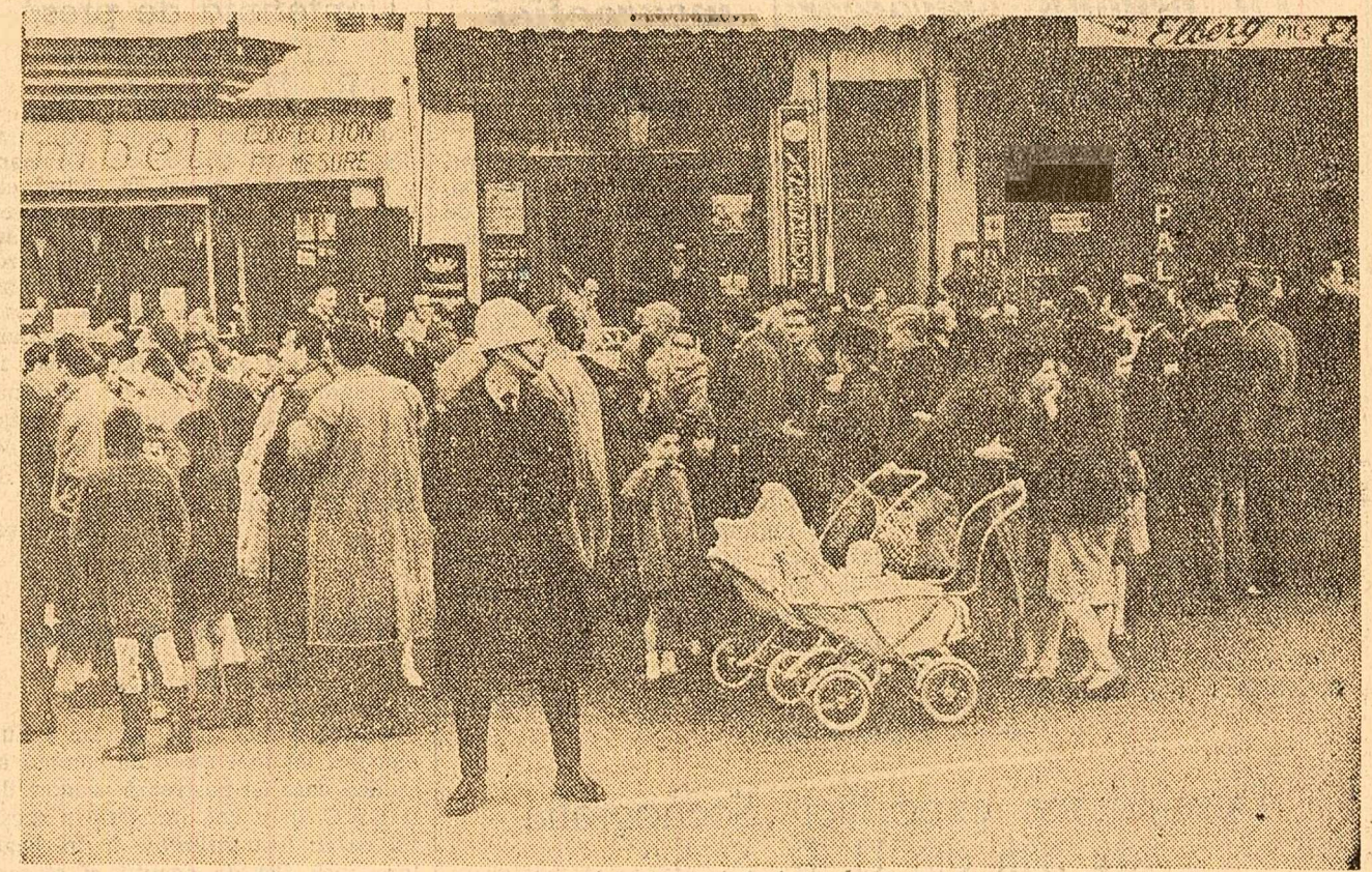
Bruxelles: Peste 1500 de cetățeni din capitala Belgiei au marșat în semn de solidaritate cu lupta poporului spaniol împotriva dictaturii franchiste.

NEW YORK 26 (Agerpres) — „Încercarea S.U.A. de a face să explodeze un dispozitiv nuclear la mare altitudine deasupra insulei Johnston, a eșuat” — relatează agenția Associated Press. Potrivit comunicatului dat publicității de către Comisia S.U.A. pentru energie atomică, racheta „Thor”, destinată să transporte un dispozitiv nuclear în pătutul inalt al atmosferei, a fost distrusă și a ars pe rampa de lansare în noaptea de miercuri spre joi. Comisia pentru energie atomică a declarat că nu s-a produs explozia nucleară. Totuși, după cum arată agențiile de Informații, în cauza există posibilități existenței unei contaminări radioactive în regiunea localității, la 17 minute după explozia rachetei nimeni nu se hotărîse încă să părăsind de această zonă. Nici agențiile de presă, nici Comisia pentru energie atomică nu precizează cauzele noului eșec al S.U.A. — al treilea la număr — în detonarea unei bombe nucleare la mare altitudine. Acest eșec a survenit după repetate amănări ale datei lansării.