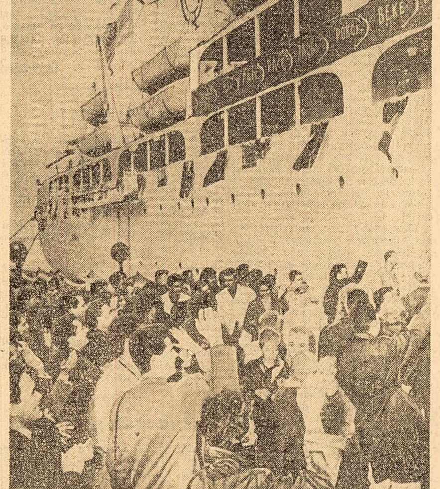
Un câlduros „la vederea”. Tinerii români flutură încă o dată eșarfele desprînzându-se de pristenii sovietici: care l-au invitat pe vasul „Guzik”, pe bord a avut loc o frățioasă întâlnire.