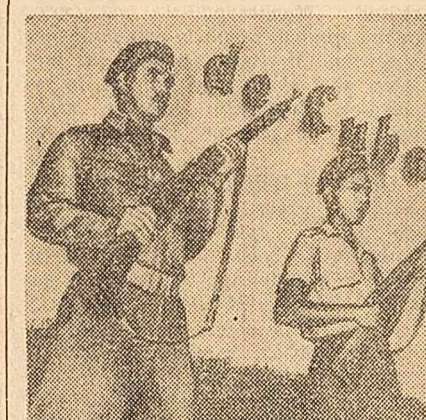
De strajă revoluției cubane

HAVANA 28 (Agerpres). — Pe întreg teritoriul Cubei continuă manifestările de protest împotriva bombardării Havanei de nave ale contrarevoluționarilor cubani care au pornit de pe teritoriul S.U.A. Lunaș cuvintul la mitingul organizat cu prilejul încheierii în patrie a sportivilor cubani participanți la jocurile sportive ale Americii Centrale și regiunii Mării Caraibilor, președintele Cubei, Osvaldo Dorticos, a declarat că „prin bombardarea Havanei imperialismul nord-