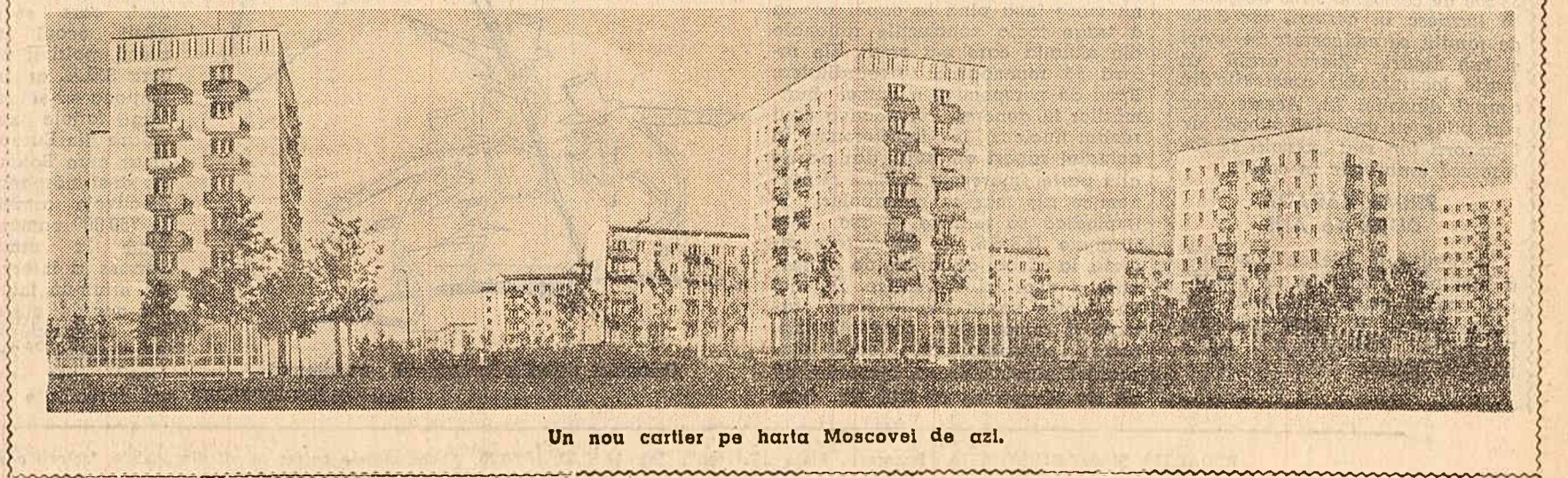
Un nou cartier pe harta Moscovei de azi.