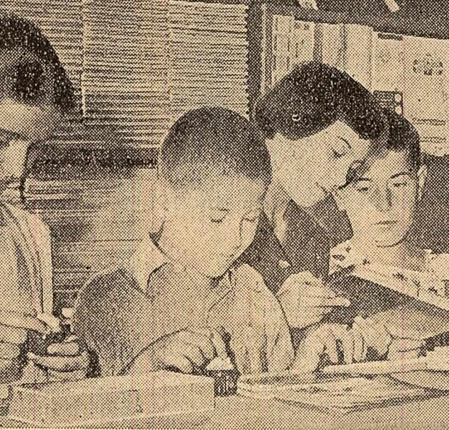
Instantaneu de sezon: cumpărînd rechiziile școlare.

Merită o deosebită atenție și metodele descrise în broșură privind înșoțirea cocenilor, tocații, înșoțirea cu furaje succulente (fecie, borhoturi) cu uree, sau cu saramură, cu melasă etc.