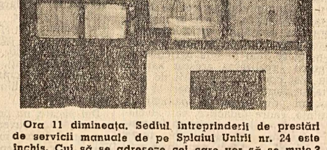
Ora 11 dimineața. Sediul întreprinderii de prestări de servicii manuale de pe Splaiul Unirii nr. 24 este închis. Cui să se adreseze cel care vor să se mule?

Cum să aștepti o săptămînă cu asemenea treburi? Unele cooperative meșteșugărești sînt specializate în efectuarea curățeniei la domiciliu. Dar nici aici nu ești întotdeauna servit cu promptitudine. Unele din ele, ca "Munca nouă", de pildă, își trimit operativ oamenii. Dar aceștia nu execută orice fel de muncă. Zilele trecute, la