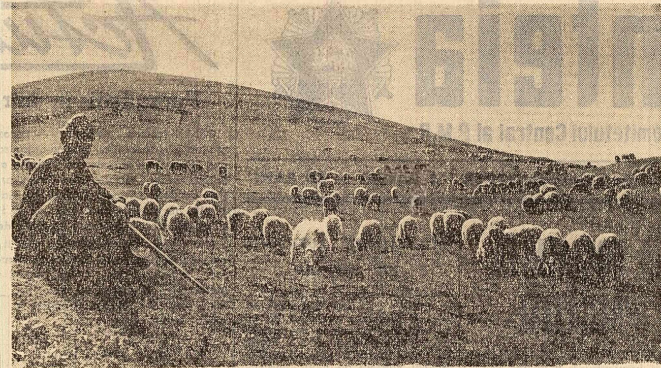
La păsune în muntii Sebeșului

Prețuirea agricolă a viitorilor colectivîști va începe chiar de pe băncile școlii de 8 ani, prin noii obiect de studiu "Agricultura", ce se va introduce din acest an de învățămînt în școlile de la sate. Este necesar ca cele aproape 7.000 de cadre didactice, care au fost pregătite timp de o lună de zile la cursuri speciale, să-și îmbogățească cunoștințele primite cu privire la sol și agrotehnică, îngrășăminte, cultura cerealelor, horticultura,