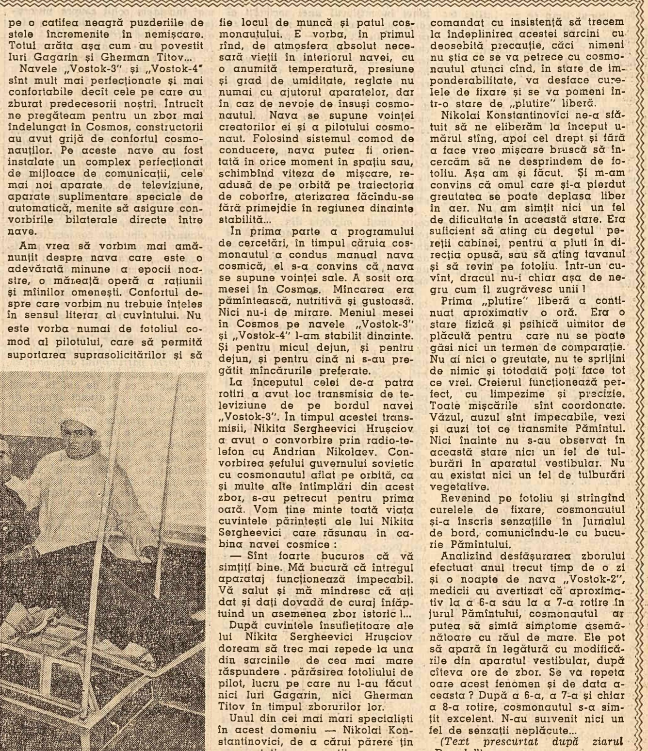
Andrian Nikolaev și echipa sa în timpul zborului lor.