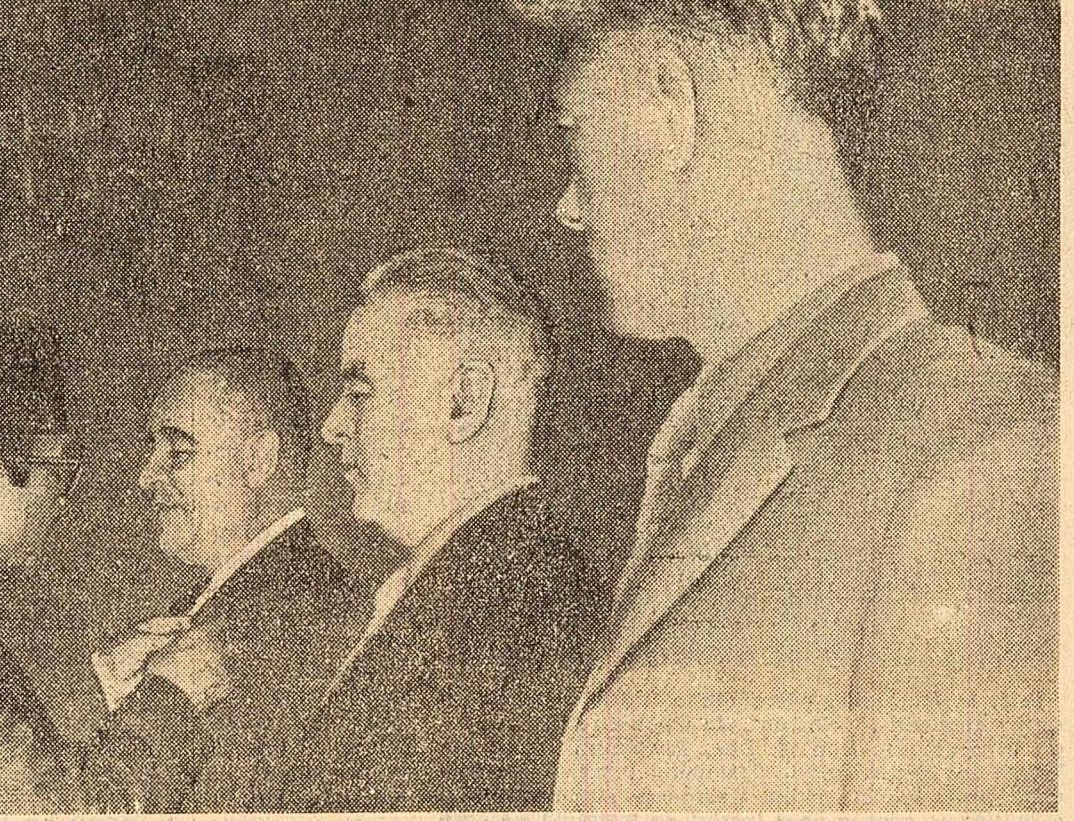
La solemnitatea înmînării înalțelor distincții acordate solilor poporului romin.