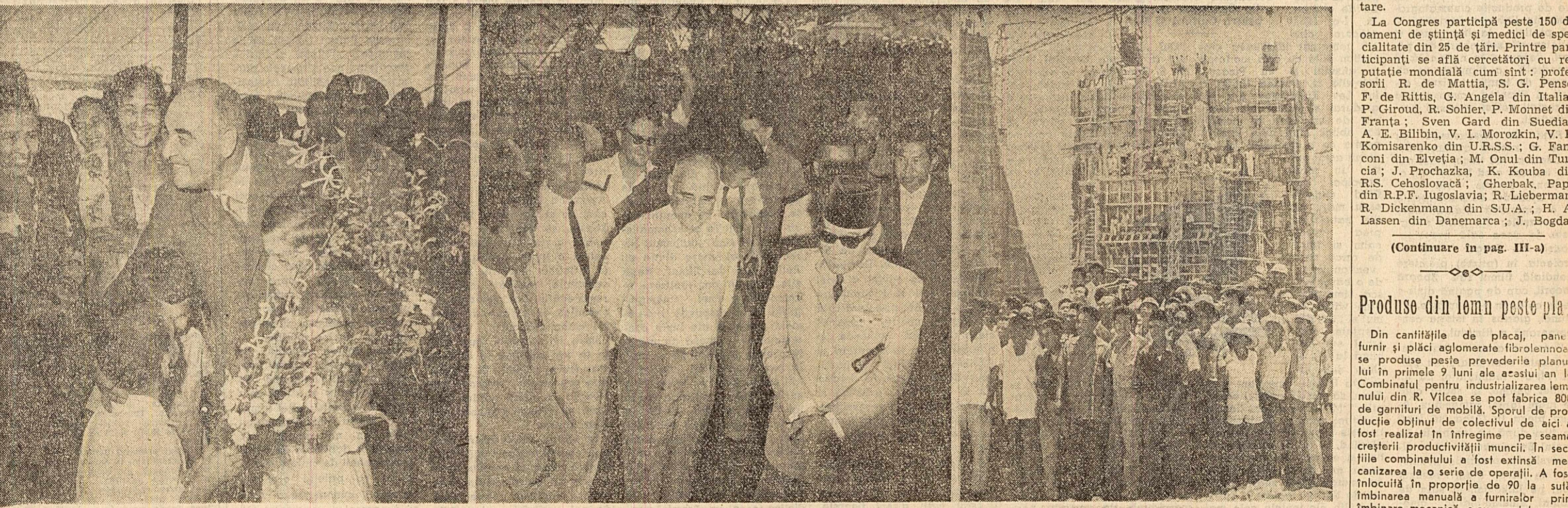
Președintele în Indonezia, solii poporului român sînt întâmpinați cu entuziasm și manifestări de profundă prietenie. În fotografiile (de la stînga la dreapta): aspect din momentul sosirii la Djakarta; în vizită la șantierul hidrocentral de la Djatiluhur; lucrători de la aceeași hidrocentrală așteptînd trecerea oaspeților.

Din cantitățile de plăci, panouri furnizate de plăci aglomerate fibrolemnoase se produce peste prevederile planului în primele 9 luni ale acestui an. Combinatul pentru industrializarea lemnului din R. Vilcea se pot fabrica 800 de garnituri de mobilă. Sporul de producție obținut de colectivul de aici a fost realizat în întregime pe seama creșterii productivității muncii. În secțiile combinatului a fost extinsă mecanizarea la o serie de operații. A fost înlocuită în proporție de 90 la sută îmbinarea manuală a furnizelor prin îmbinare mecanică, s-au montat ascensoare pentru alimentarea cu materie primă a unor utilaje etc. (Agerpres)