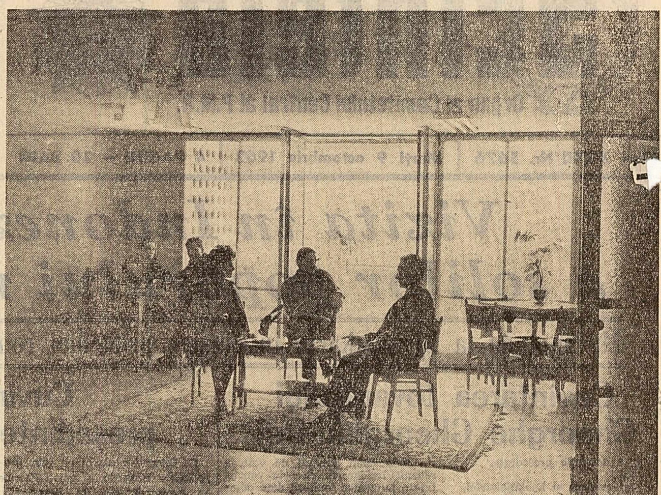
Holul hotelului "Dunarea" din Galati.