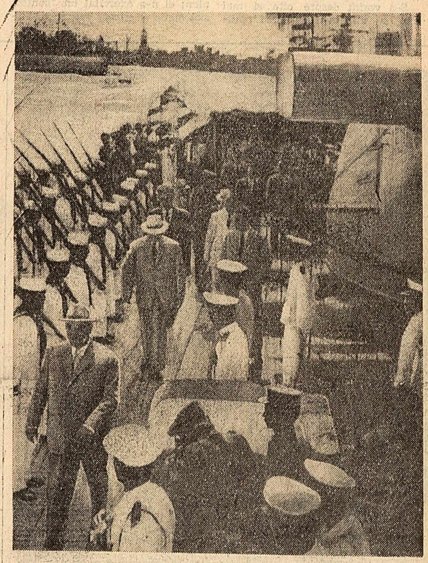
Pe bordul unei nave a flotei militare indoneziane

Partea a doua a procesiunii a fost consacrată artei. Multe dansuri și orchestre, printre care am admirat pe maestrul dansator cu vestitele măști balneze. Ei își dau ostentivă și impresionează pe oaspeți, să le facă plăcere prin pitorescul artelor lor și se poate spune că au reușit. Am văzut un ansamblu de operă tradițională, din aceea care sînt aici atît de răspîndite încît aproape fiecare are două ori mai înalte decît oamenii, măști uriașe, vestigii artistice ale unei drame religioase de ve vremuri.