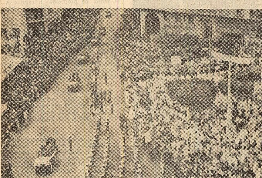
ALGER. Aspect de la sărbătorirea Zilei naționale de luptă pentru independența Algeriei.

BERLIN. În seara zilei de 2 noiembrie în cartierul vest-berlinez Neukölln elemente fasciste înarmate au atacat pe participanții la conferința Partidului Socialist-Unit din Germania pentru desemnarea candidaților în vederea alegerilor pentru Adunarea orășenească de deputați din Berlinul occidental și Adunarea raională din Neukölln. Mai mulți delegați la conferință au fost răniți.