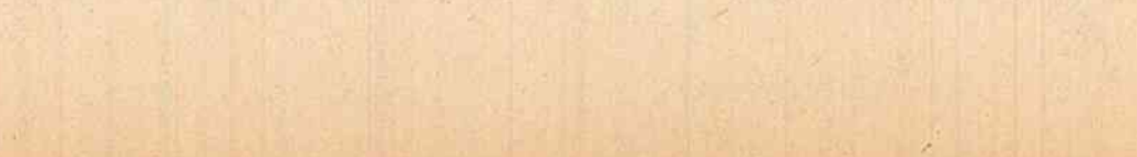
Pe aeroportul Băneasa, la sosirea solilor poporului sovietic.

re de 11 milioane de lei. Colectivul Uzinei „Victoria” din Florești, ca urmare a micșorării consumurilor specifice la fabricarea impetantelor — are după forjarea liberă o greutate de 240 kg, pentru ca, după prelucrare, să ajungă la numai 108 kg; corpul pompei are, după forjare, 104 kg și scade după prelucrare la 23 kg. Dacă s-ar înlocui forjarea liberă prin matritare la aceste repere, cit și la altele, s-ar realiza, pe lingă economii de metal și scule, și o însemnată creștere a