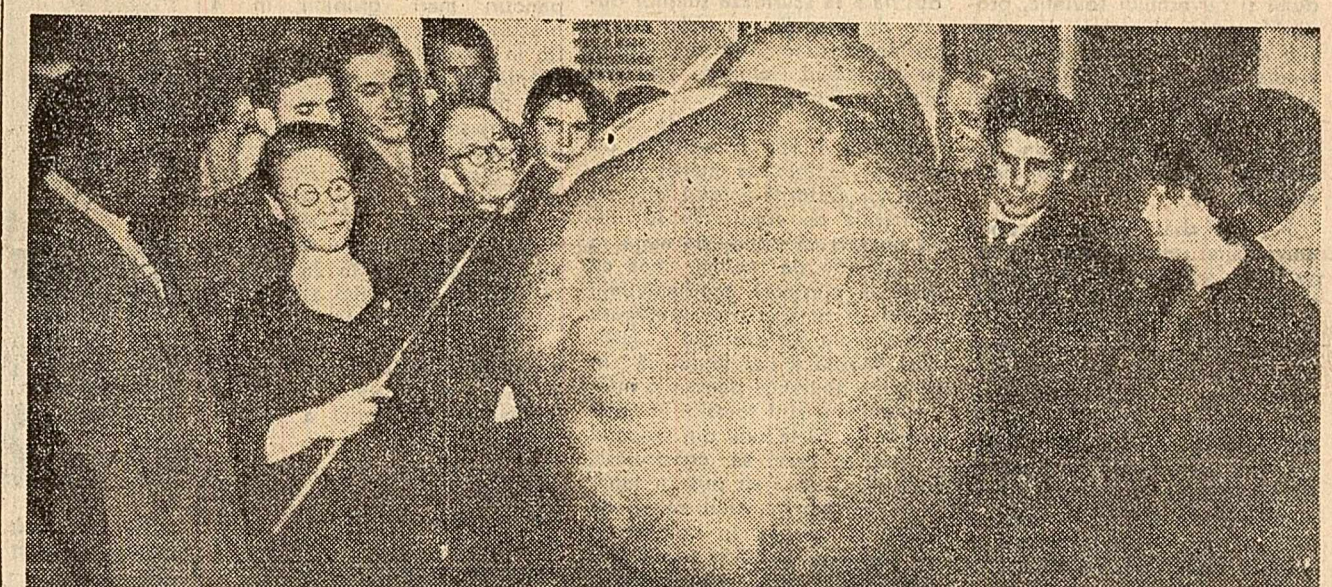
La Planetațiul din Moscova, vizitatorii ascultă cu viu interes, în fața unui glob al planetei Marte, explicații în legătură cu zborul stației automate interplanetare „Marte-1”.