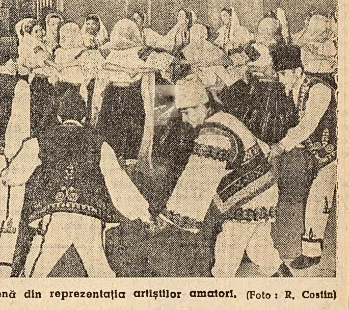
O scenă din reprezentația artiștilor amatori.