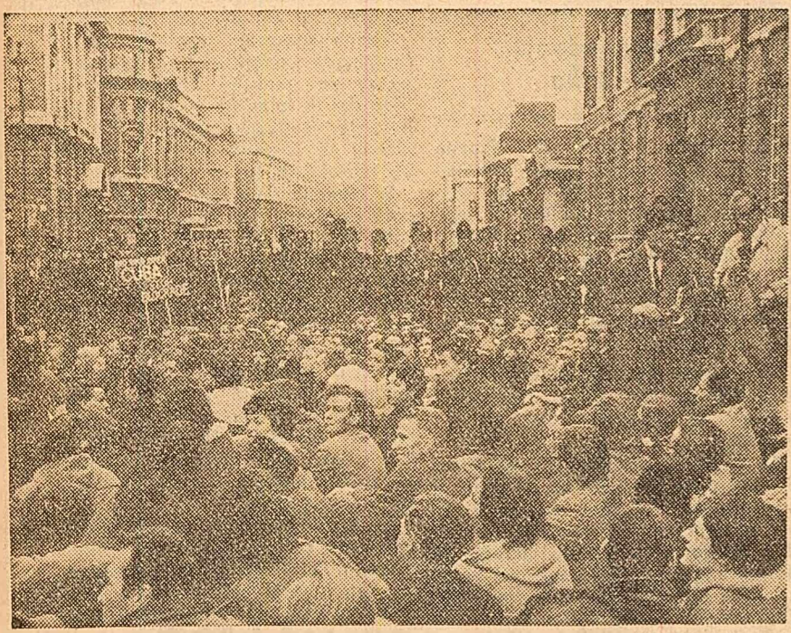
Demonstrație la Londra în sprijinul poporului cuban.