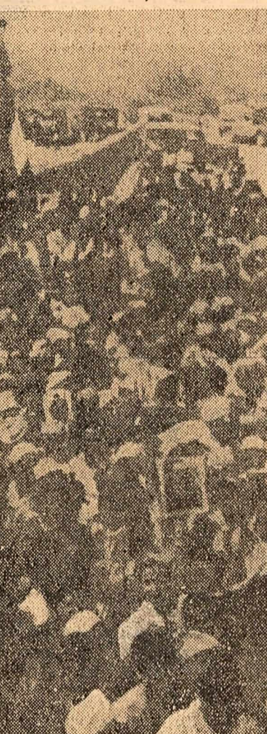
Aspect de la o manifestație populară din Yemen în sprijinul revoluției.

ROMA. Smbătă seara s-au încheiat la Roma lucrările ședinței Consiliului de Securitate al Comunității Europene a Scriitorilor. S-a hotărît ca în zilele de 15-20 mai 1963 să aibă loc la Varșovia Congresul internațional al scriitorilor din țările europene. Din partea R.P. Romine a participat Mihael Beniuc, președintele Uniunii Scriitorilor.