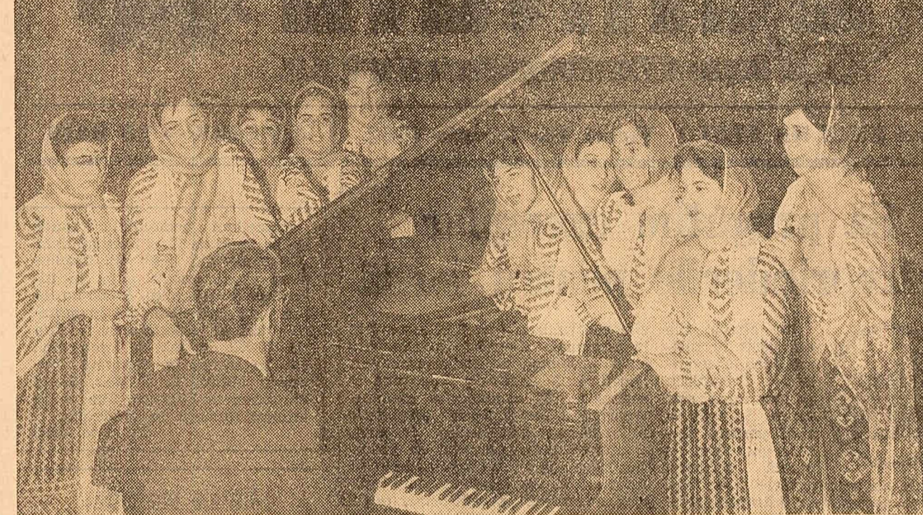
La Casa de cultură a tineretului din raionul „Grivița Roșie”, Cîntă un grup vocal de la școala medie nr. 4 „Aurel Vlaicu” din Capitală.