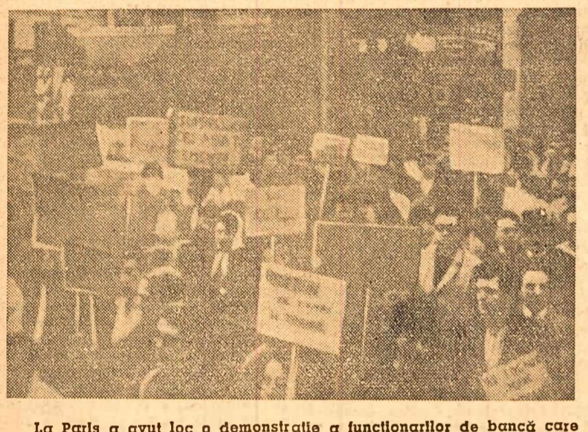
La Paris a avut loc o demonstrație a funcționarilor de bancă care cer majorarea salariilor.

Reprezentantul R. P. Romine a subliniat că abolirea totală a sistemului colonial sub toate formele și manifestările sale constituie o chestiune urgentă a cărei soluționare nu poate suferi amîinare.