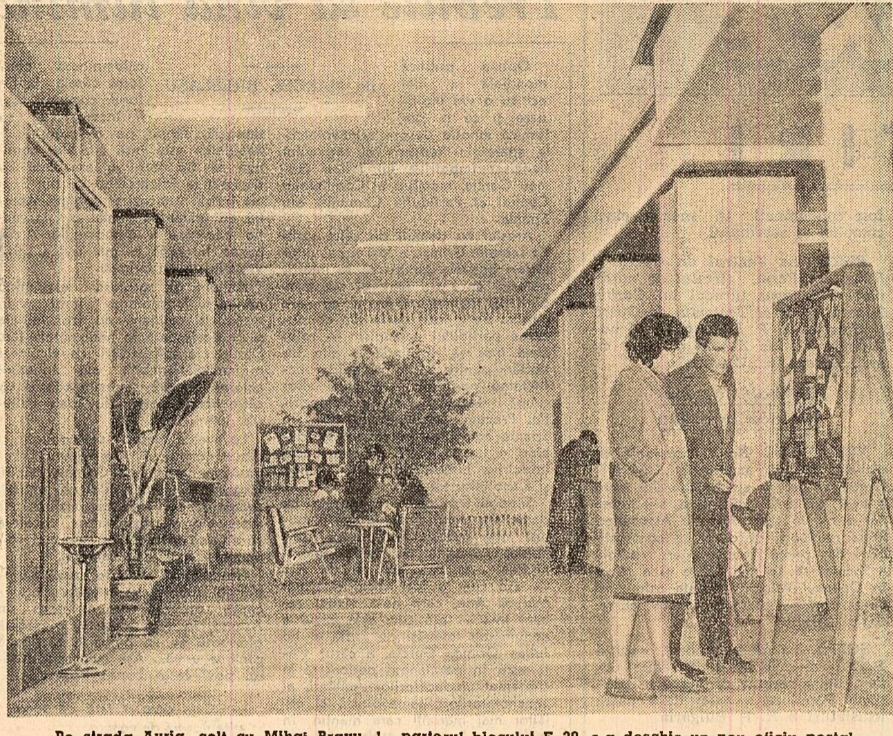
Pe strada Avrig, colț cu Miha Bravu, la parterul blocului E 20, s-a deschis un nou oficiu poștal — București 39. Pe lângă ghișeele poștale, la dispoziția publicului stau 7 cabine telefonice pentru convorbiri locale, interurbane și internaționale.

Un feroviar fruntaș: Vaclav Petr. HORTIA LIMAN