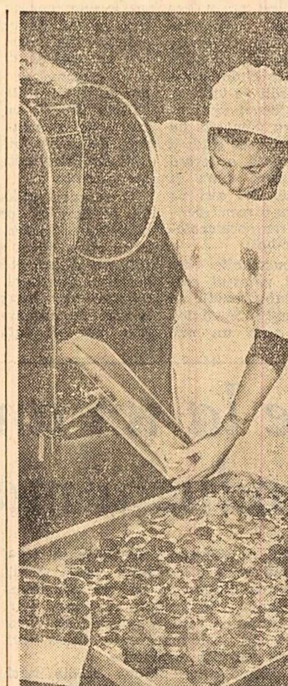
La fabrica de ciocolată din București.

Chiar de la începutul activității noastre ne-a preocupat ca sediul consiliului să aibă ocaziile să se desfășoare în condiții bune, să se poată desfășura activitatea de muncă, membrii consiliului — muncitori și tehnicieni etc., in total 19, din toate secțiile — sint oameni cu prestigiu in fabrică, in cartier in care locuiesc și care și-au înțeles bine rolul lor ca și al consiliului.