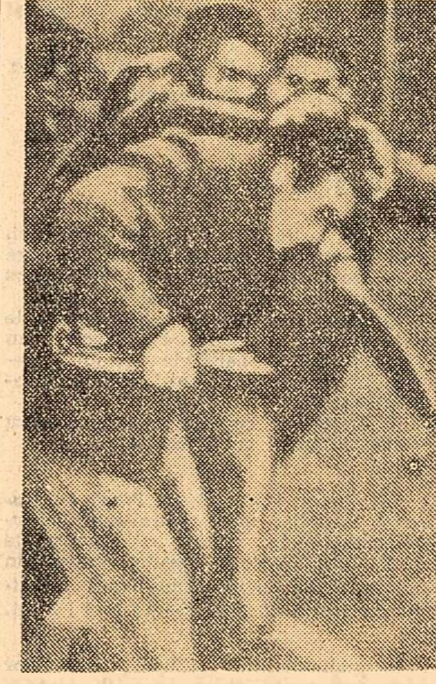
La Roma au avut loc ciocniri violente între poliție și muncitorii constructori aflați în grevă.

GENEVA 29 (Agerpres). — TASS: Miercuri după-amiază la Palatul Națiunilor a avut loc o ședință ordinară a Subcomitetului celor trei puteri în problema încetării experiențelor cu arma nucleară, care s-a ținut sub președinția lui S. K. Tarapkin, reprezentantului Uniunii Sovietice. După cum s-a aflat, în ședința de miercuri a subcomitetului delegații occidentale nu au prezentat nici un fel de propuneri noi de natură să urnească din loc tratativele ca și în ședințele precedente. Agenția Reuter relatează că „oficialitățile americane menționează că comunicatul americano-belgian a fost publicat exact în momentul în care guvernul central al lui Cyrille Adoula simte că se clatină”. Într-adevăr, acest guvern, prin intermediul căruia S.U.A. năzuiesc să realizeze planurile de subordonare a Congo-ului, s-a subrezit tot mai mult, fiind lipsit de sprijinul masei și al forțelor politice patriotice. Creșterea continuă a influenței acestor forțe este relevată și de faptul că, sub presiunea opiniei publice, guvernul s-a văzut nevoit să pună în libertate pe deputatul Gbenye, tovarăș apropiat de luptă al lui Lumumba, și alți trei parlamentari areștați samavolnic în ultimul timp. Faptele arată că în opinia publică din Congo are loc un proces de clarificare, că masele se unesc tot mai mult în jurul acelor forțe care militează hotărît pentru unitatea și integritatea teritorială a țării, pentru o reală independență națională. NICOLAE N. LUPU