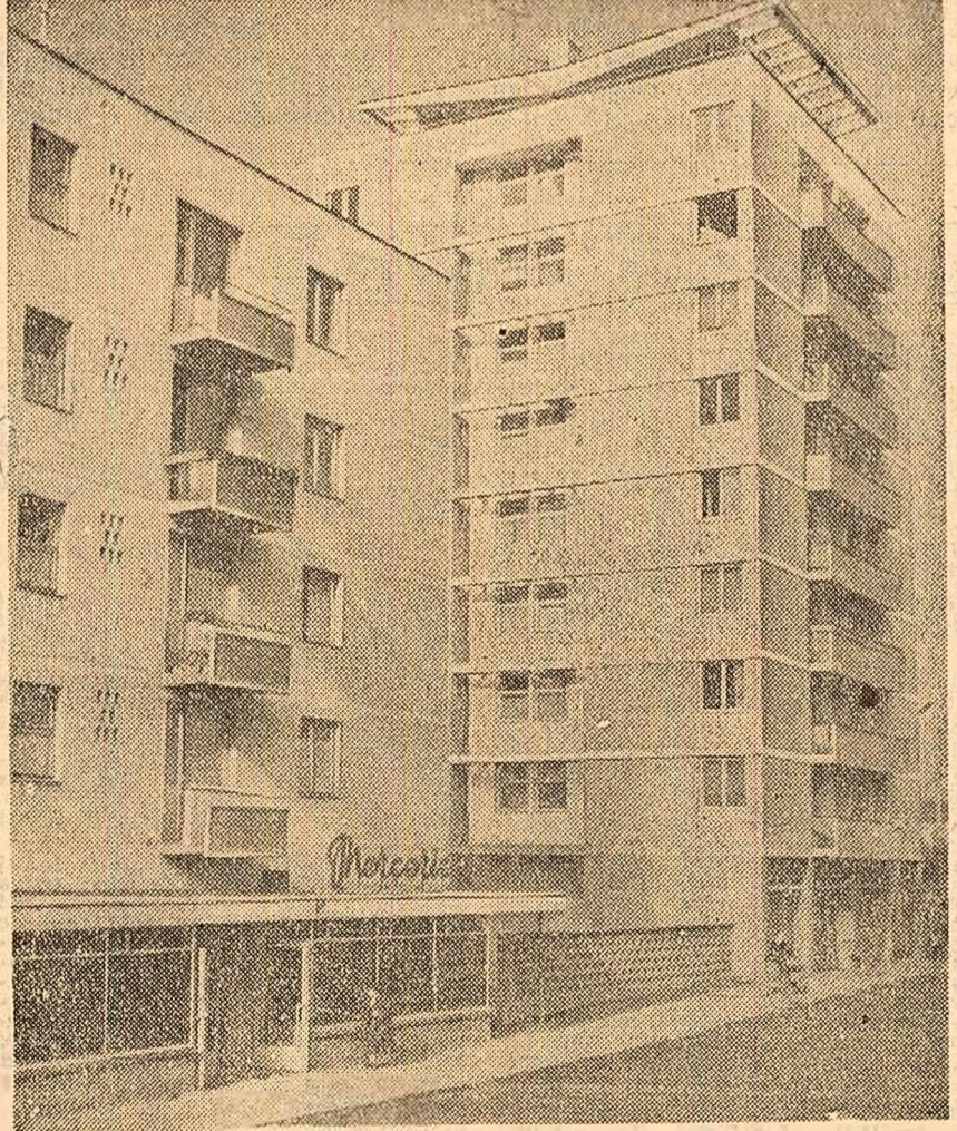
Noi construcții la Oradea