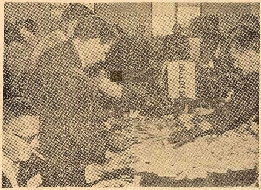
Fotografia înfățișează pe mecanicii de la „Lockheed-Aircraft Co” vînd pentru declararea grevei.

WASHINGTON 29 (Agerpres). — Agențiile occidentale de presă a anunțat că în urma intervenției directe a guvernului S.U.A., greva mecanicilor de la uzinele și întreprinderile firmei americane „Lockheed Aircraft”, declarată la 28 noiembrie în semn de protest împotriva refuzului cercurilor patronale de a recunoaște drepturile sindicale ale muncitorilor a luat sfârșit. După cum informează agenția France Presse, greva, la care au luat parte 26 000 de muncitori, a paralizat activitatea în cinci uzine importante ale societății „Lockheed”, situate în California. Citînd „surse înalte de la Casa Albă”, aceeași agenție anunță că greva „a afectat o parte importantă a producției de rachete balistice, vehicule spațiale și a industriei militare”. Potrivit agenției Associated Press, atât patronii cît și muncitorii au acceptat „recomandarea” guvernului de a aștepta raportul ce urmează să fie întocmit de o comisie specială de anchetă instituită de președintele Kennedy.